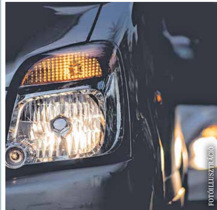
Indulás előtt mindig ellenőrizzük az autó világítását is!

Ködben, illetve nagyon erős esőben kapcsolja fel az első-hátsó ködlámpákat! Ne feledje, a balesetek elkerüléséért a közlekedők tehetnek a legtöbbet! (Forrás: police.hu)