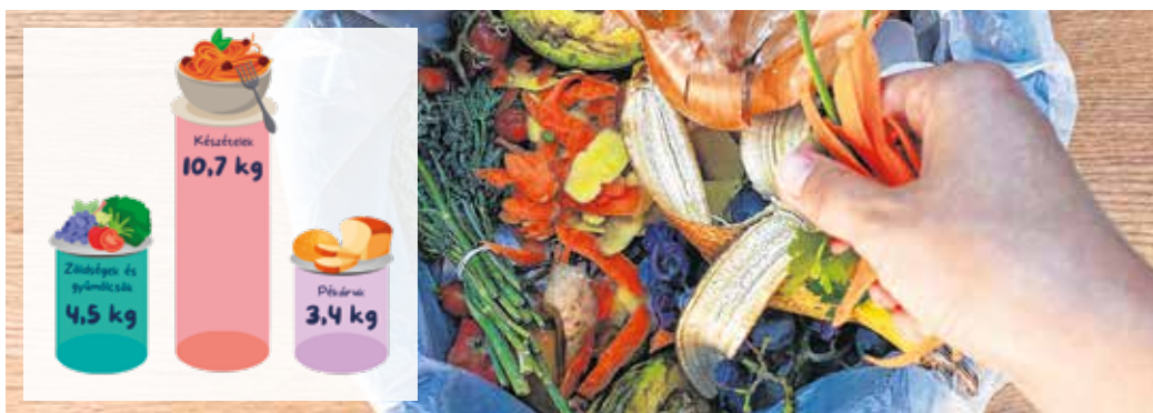
A legnagyobb mennyiségben a készételek kerülnek a kukába.

A munch.hu honlapja és applikációja segítségével rengeteg – közeli lejáratú vagy éppen hibás csomagolású – ételt menthetünk meg a szemétkosárba dobás elől kedvezményes áron.