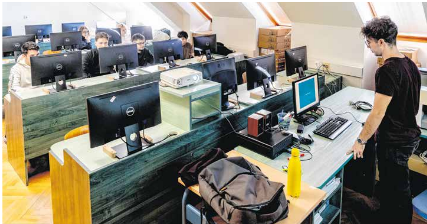
Idén több mint ezer diák iratkozott be a Handler Nándor-technikumba.