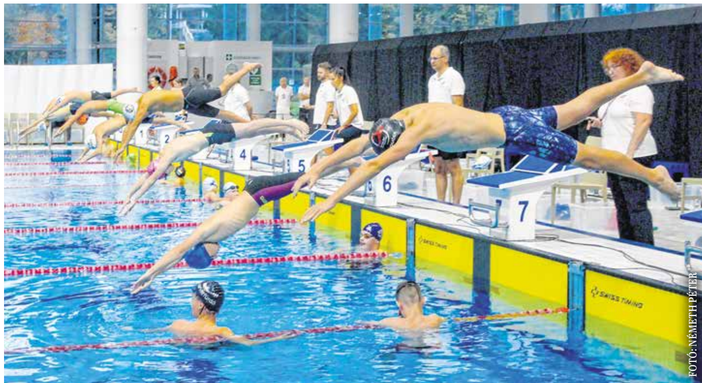
A 43. Dr. Csik Ferenc Emlékversenyen 53 egyesület sportolói vettek részt. A legeredményesebb soproni úszókat elismerték.