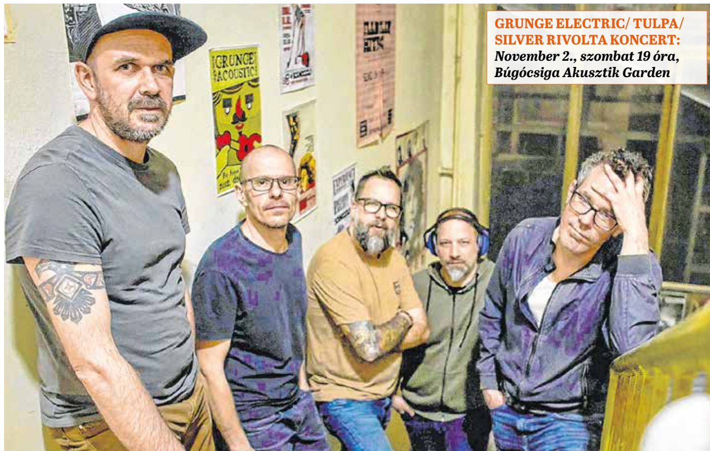
A Grunge Electric tagjai nemcsak együtt zenélnek, de a privát életben is jó barátok.

„Csuszkó” hozzátette, repertoárjukban az elmúlt időszakban annyi változás történt, hogy több eddig általuk még nem játszott Pearl Jam-dalt is először hoznak el a Búgócsiga színpadára,