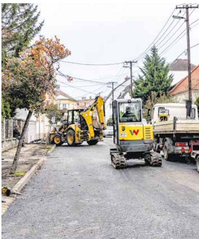
A szakemberek az utolsó simításokat végzik, így rövidesen újra járható lesz a Wesselényi utca is.

Az elmúlt időszakban több mint száz út és utca újult meg Sopronban.