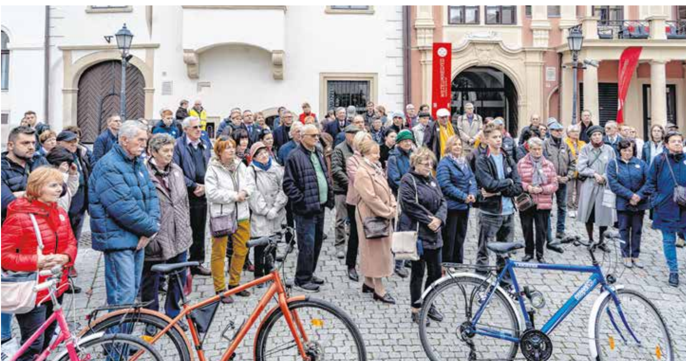
A Rotary sétán a Soproni Múzeumnegyed és a Várfal sétányt nézték meg a résztvevők.

Azonban már ezeken az évtizedeken is túl vagyunk, s a soproniak visszatérhettek a gyökereikhez.