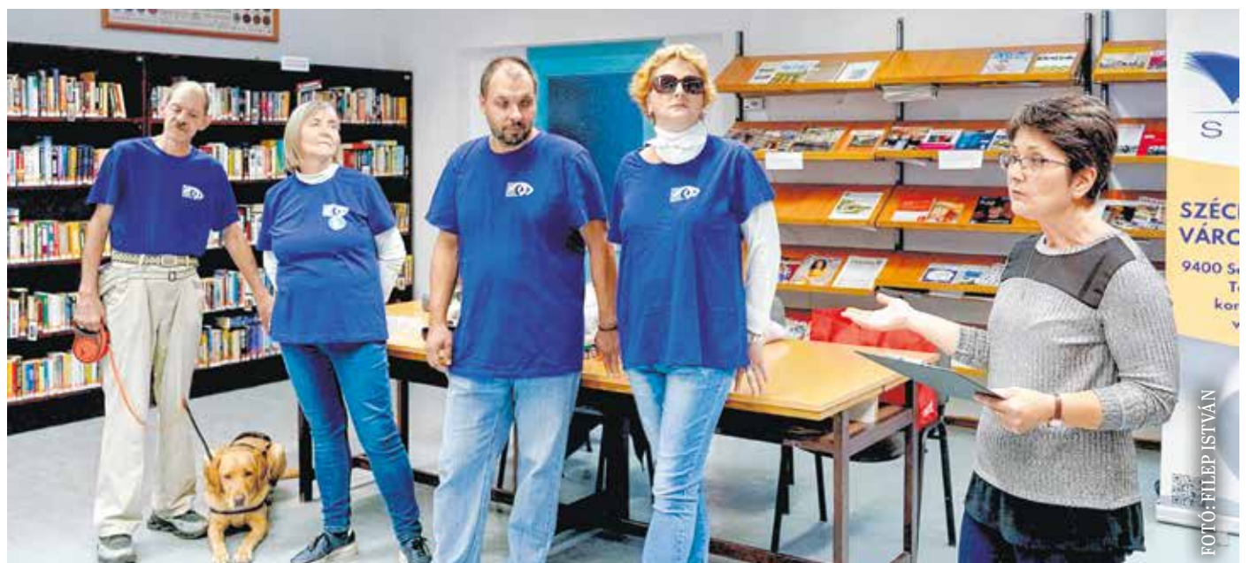
Szemléletformáló beszélgetést tartottak a vakok és gyengénlátók soproni kistérségi csoportjának tagjai a könyvtárban.

A csoport kiemelkedő programja a fehér bot nemzetközi világnapjának a megünneplése, a Halász utcai tagóvoda pedagógusai évről évre szívhez szóló műsorral lepik meg a látássérülteket. A csoport sokat köszönhet a Lions Club Sopron állandó támogatásának, így most már szép hagyománnyá vált a vakszüret, a csoport tagjainak szóló színházbérletek ajándékozása, illetve a különböző jótékonyági programokból befolyt anyagi támogatás.