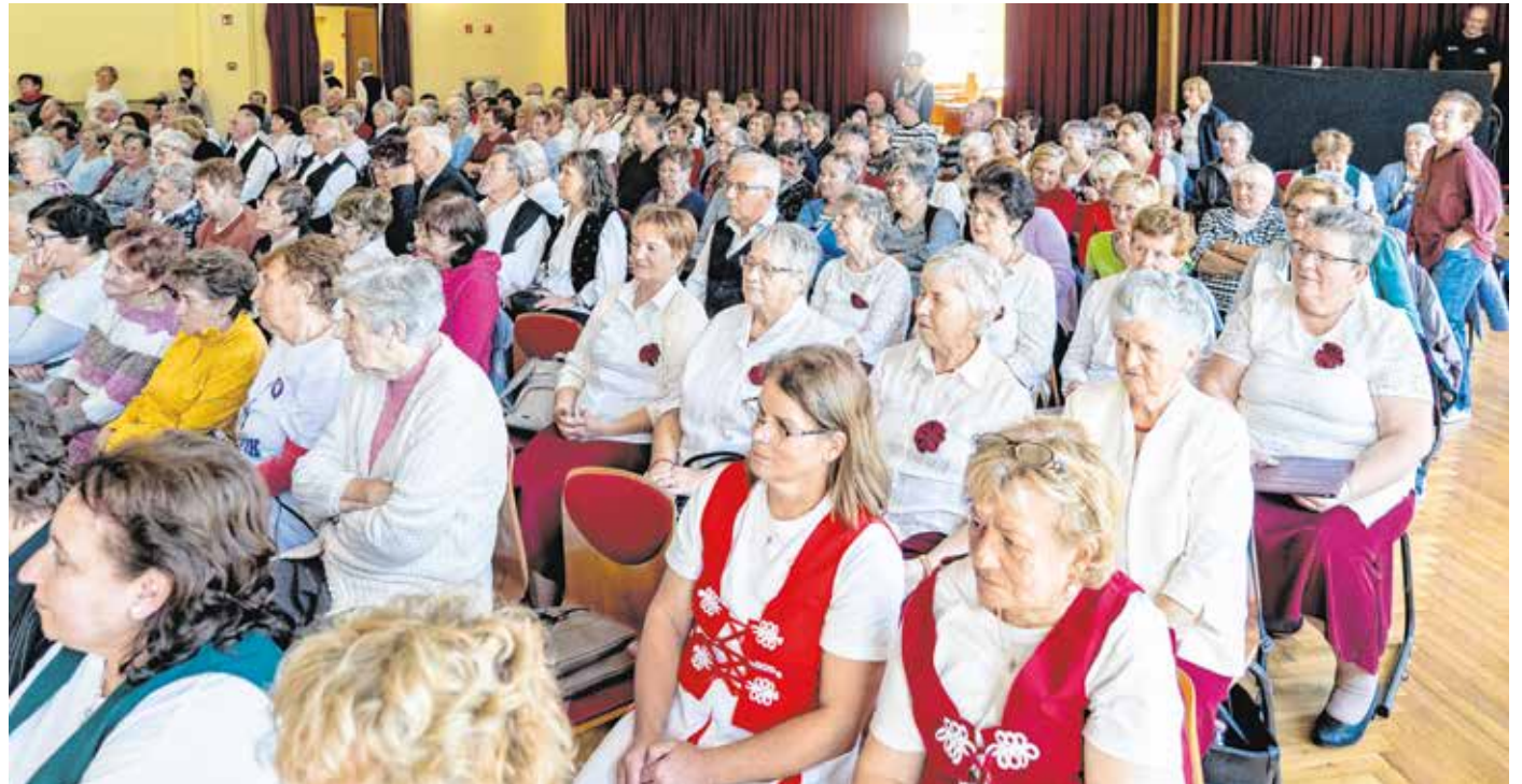
A GYIK Rendezvényházban tartották múlt csütörtökön is az idősek világnapja soproni programjait.

dél előtt „elindult a menet”: a gyalogló klubok Monspart Sarolta emlékére közös kirándulásra invitálták tagjaikat. Ezt követően Monspart Zsolt, az Egészséges Életmóddért Alapítvány elnöke