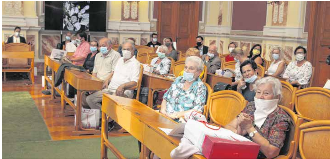
A Virágos Sopronért verseny valamennyi résztvevője ajándécsomagot és oklevelet kapott – a győztesek pedig értékes vásárlási utalványt is