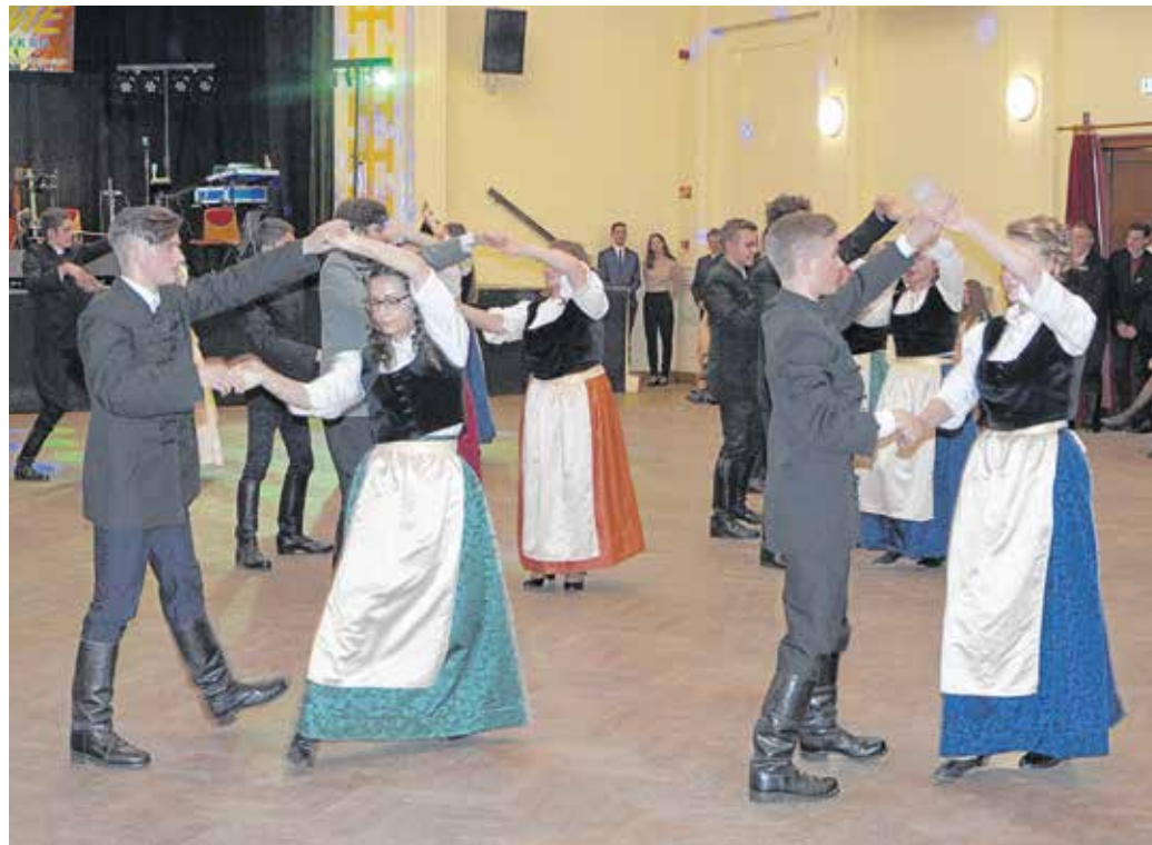
Továbbra is népszerű az Eötvös- és Roth-iskolában működő dalárda és tánckör – a diákok rendszeresen fellépnek az iskolabálokon is