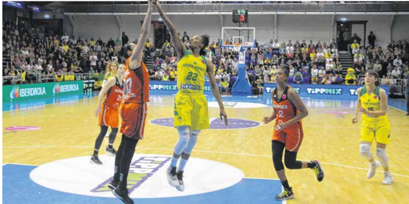
A Sopron Basket a Galatasaray, a Bourges (felvételünkön) és a Basket Landes csapataival játszik majd egy csoportban az idei Euroligán

Előzetesen két változatról szavazhatott a 18 érintett csapat, valamint az együttesek 10 nemzeti szövetsége. A voksolás döntetlennel zárult, így végül a FIBA hozta meg a végső döntést. Eszerint október végén rendezik a selejtezőket, majd 16 csapat