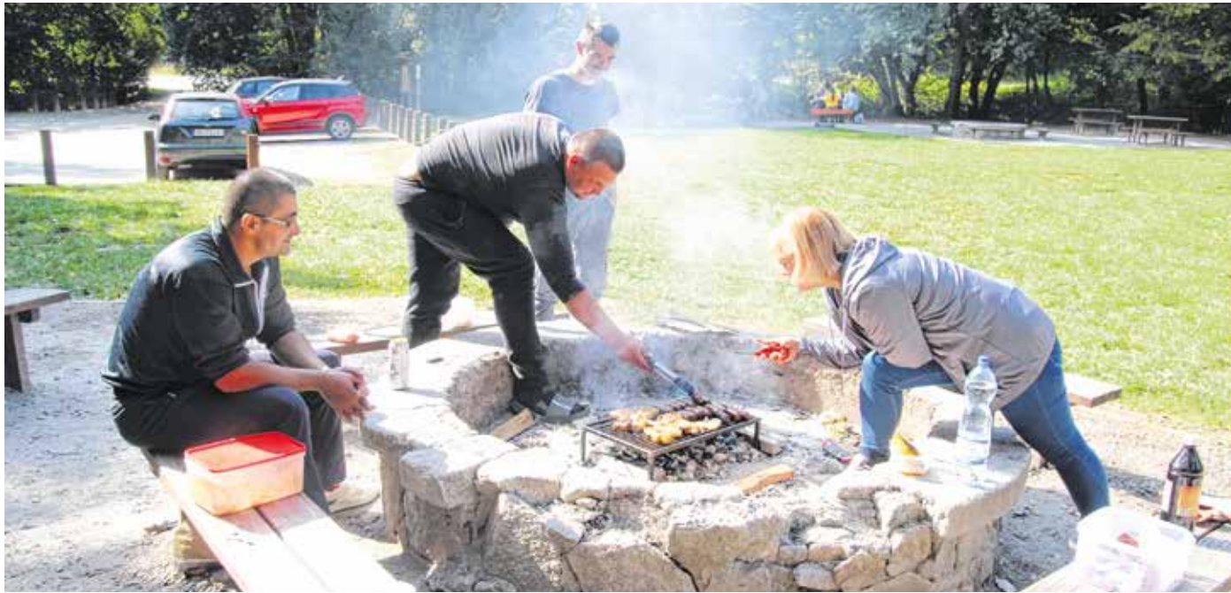
Az autópihenőben a tűzrakóhelyeken darabolt tűzifát is biztosít a TAEG Zrt.