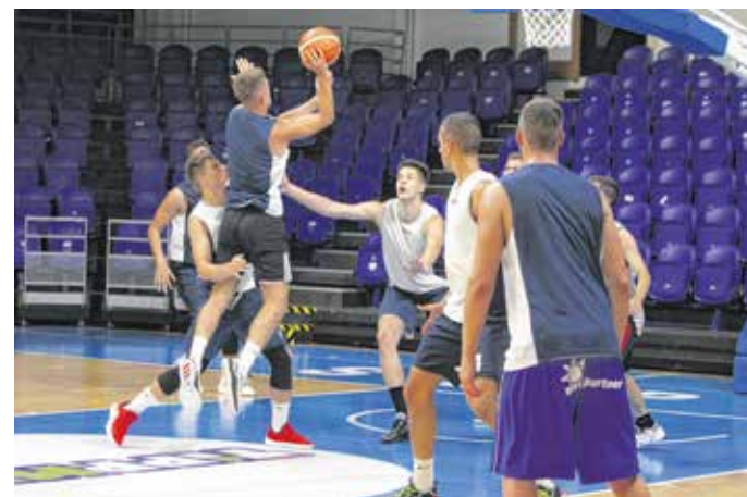
Edzésen az SKC csapata – már a Krasznai Kupára készülnek a soproni kosarasok

Az ügyvezető hozzátette: a városvezetés és a Novomatic-aréna üzemeltetőjének pozitív hozzáállása eredményeként az a döntés született, hogy korlátozott számban bemehetnek a nézők a mérkőzésekre. Ugyanakkor elsődleges szempont volt a csapatok és a közönség egészségének védelme. Ezért mérkőzésenként 500 szurkolót engednek be, a nézők csak maszkban léphetnek a csarnokba, amelyet a meccsek alatt is viselni kell. Belépéskor ellenőrzik a testhőmérsékletet, lesz lehetőség kézfertőtlenítő használatára. Belépni csak az aréna