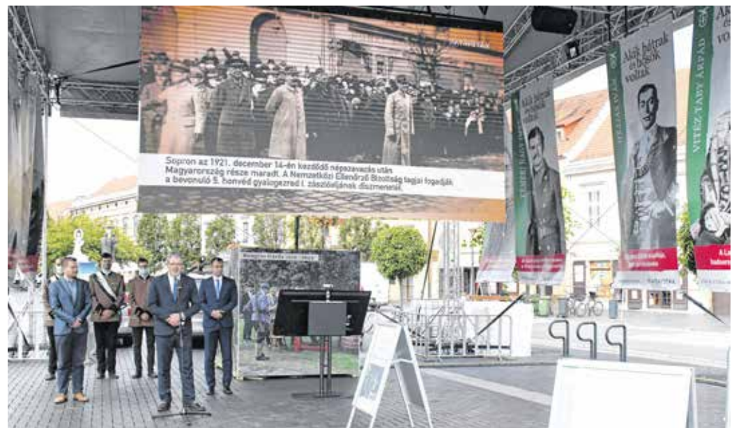
A tárlaton filmek és molinók mutatják be a történelmi eseményeket, de kipróbálhatják a különleges greenbox technikát is az érdeklődők