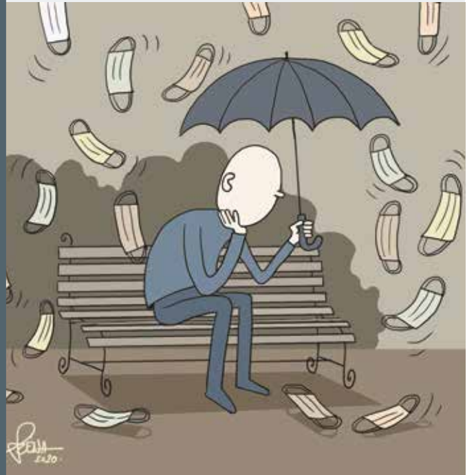
Szénási Ferenc (Széna) soproni karikaturista alkotásai hétről hétre.