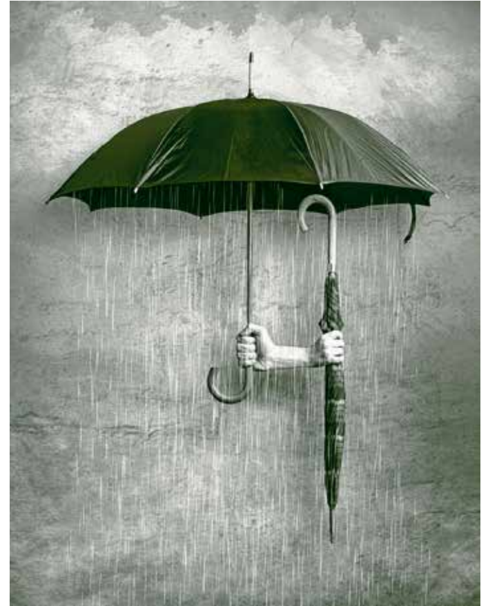
A díjnyertes Eső című kép