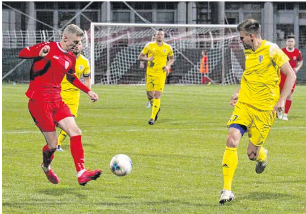
A BVSC-Zuglót nem sikerült legyőzni hazai pályán, így búcsúzott a kupaszerepléstől az SC Sopron

A kupabúcsú után ezúttal 8 napja van felkészülni a következő ellenfélből Weitner Ádámnak és a stábjának, hiszen vasárnap a BKV Előre csapatával mérkőznek. Aktuális ellenfelük a tabella 18. helyén tartózkodik, az eddig