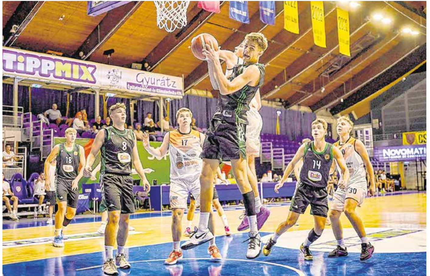
A Soproni Sportiskola Kosárlabda Akadémia U19-es együttese európai topcsapatok ellen játszott Sopronban.