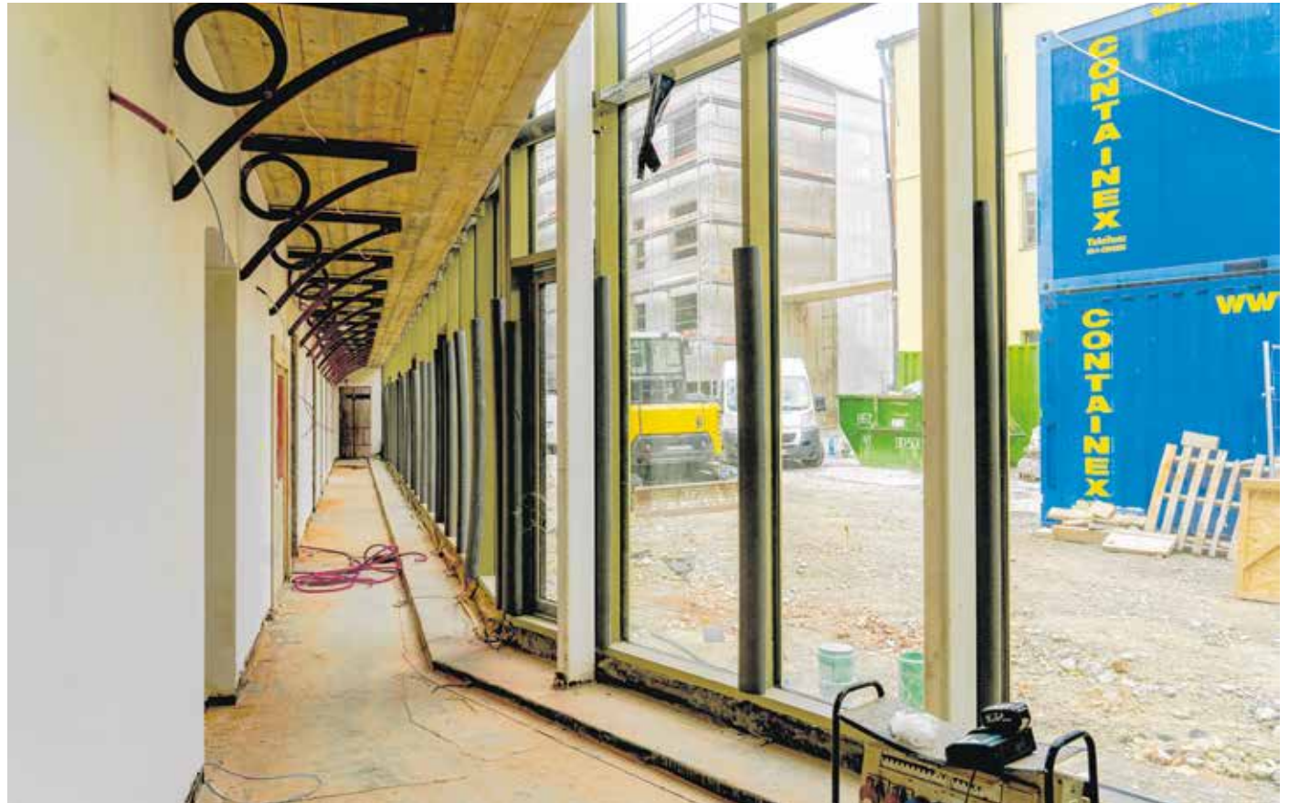
Közel 4000 négyzetméteren alakítják ki a papréti műemléki környezetben a Darazsak Sportakadémia kampuszát. Az épületben az előadótermek, tanulószobák mellett például kollégium és sportmenza is helyet kap.