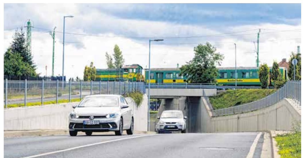
A Kőszegi úti aluljáró fontos a város forgalmának enyhítésében.

A második világháború utáni évtizedekben nagyméretűre duzzadt Sopron két legfontosabb ipartelepe. Az északnyugati iparnegyed volt a legnagyobb (Sotex, Afit, Épfa, öntöde), de mellette a délkeleti iparnegyed (tűgyár, selyemipar) is mintegy négyezer dolgozót foglalkoztatott. A Kőszegi út környékén 1901-ben indult a termelés a Wellesz és Schwitzer-féle Első magyar cipőgyárban,