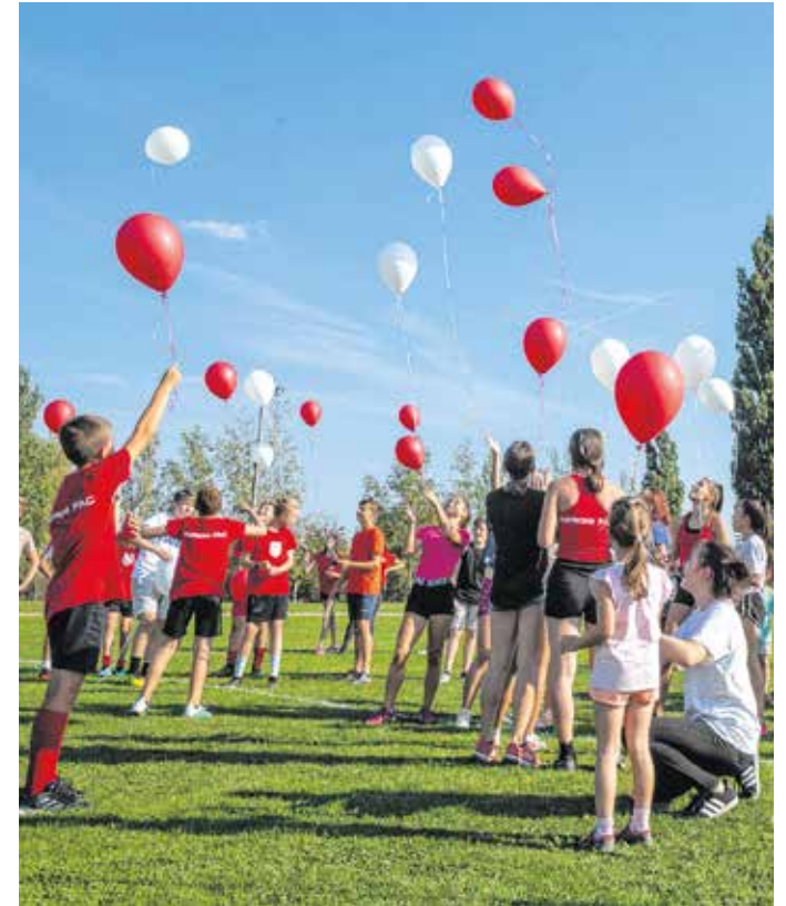
A fiatalok a program végén engedték fel lufikat

egyesülete a SFAC, amely 1900-ban alakult meg Soproni FC néven. Néhány éven belül a pálya szélén megjelentek az atléták is, így a klub 1908-ban felvette a Soproni Football és Atlétikai Club nevet. 1920-ig a háború és az azt követő események miatt a működésük szünetelt. Ebben az évben viszont már elindultak a