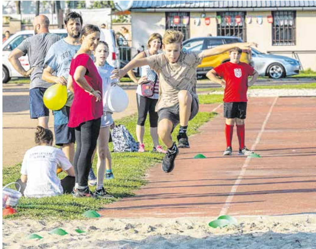
A SFAC atlétikai szakosztálya idén januárban alakult újjá