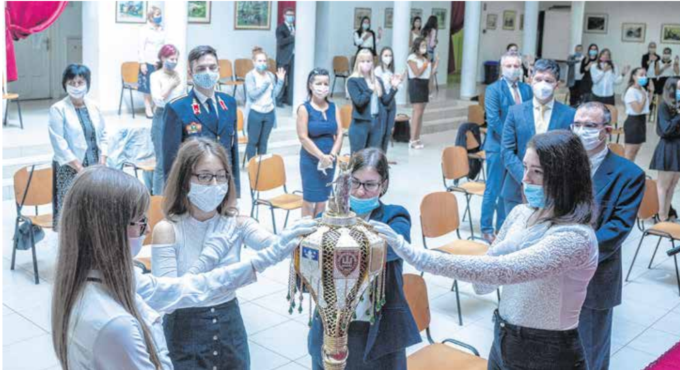
Bal kezüket a jogarra, a jobbot a szívük fölé emelve tették le esküjüket az elsőévesek