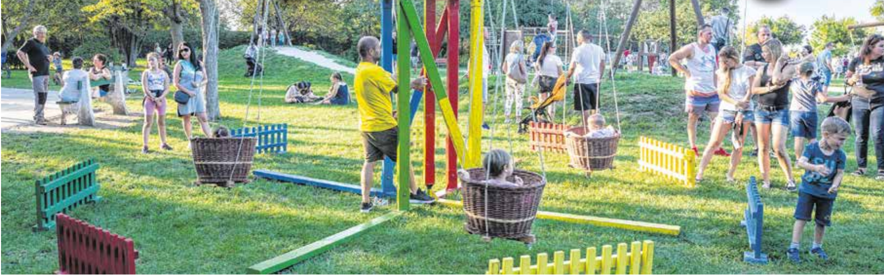
A Citadellánál fából készült gyerekjátékok és izgalmas programok várták szombaton a családokat