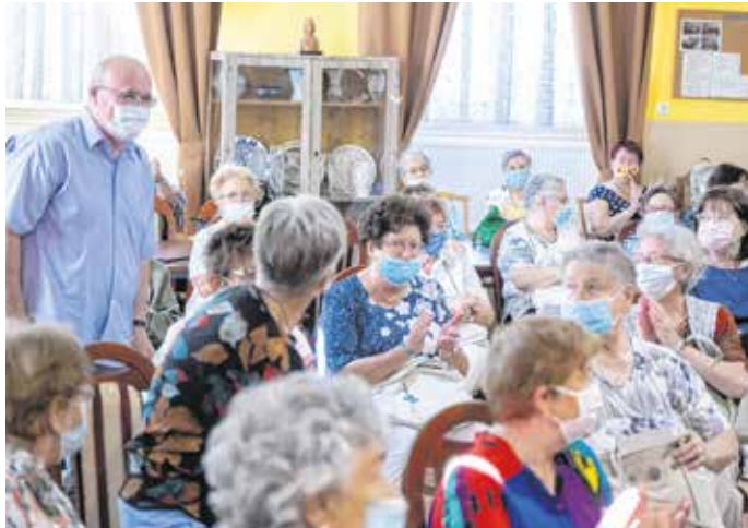
Új programokat indítanak ősszel a Pedagógusok Soproni Művelődési Házában