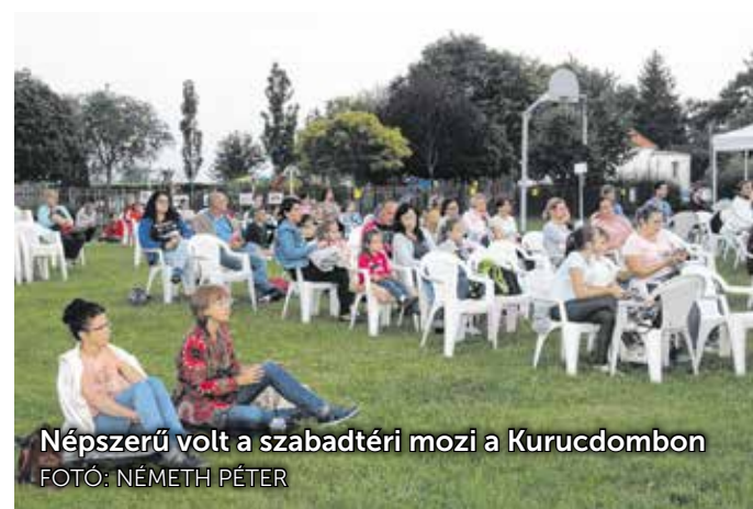
Népszerű volt a szabadtéri mozi a Kurucdombon

is. A járványhelyzet miatt korlátozták a résztvevők számát, de azok, akik nem tudták személyesen megnézni a koncertet, megtekinthetik a teljes felvételt a Pro Kultúra oldalán.