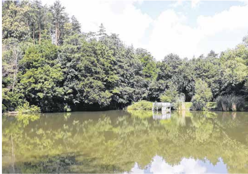
A Szalamandra-tavat 1977-ben mesterségesen hozták létre, két részből áll

A TAEG Zrt. 2013 júniusá- ban esőbeállólal, a tó alatt és felett lévő tűzrakó helyek és a hozzájuk tartozó asztal-pad garnitúrák felújításával, vala- mint a forrás környezetének