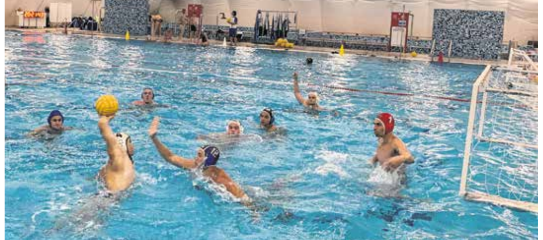
A soproni pólósok nyáron fárasztó edzéseken, hétfőnként pedig felkészítő tornákon vettek részt