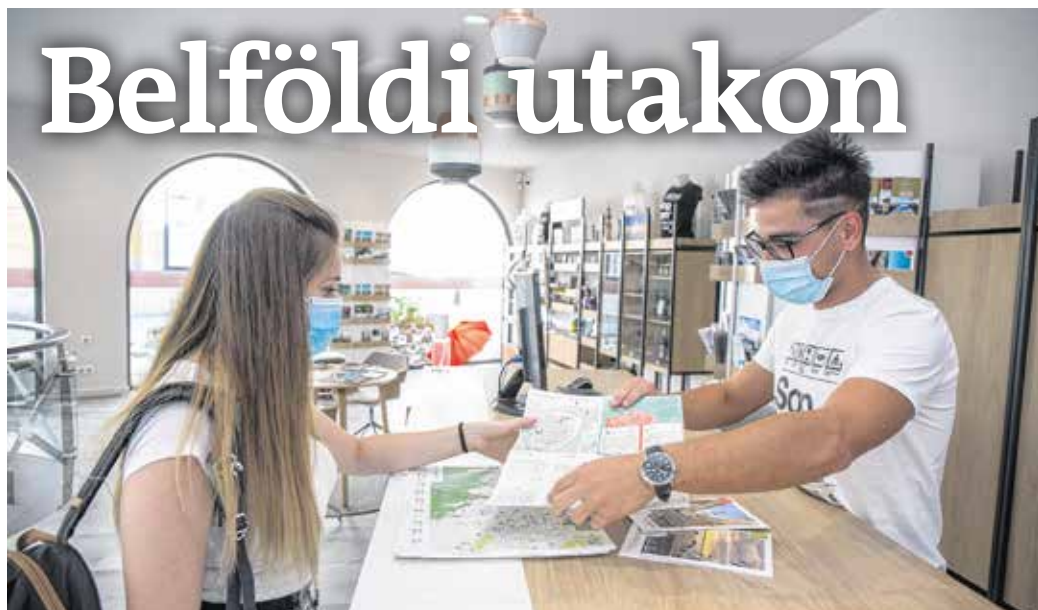
A megújult soproni tourinform irodában bő két hónap alatt közel 4000 érdeklődő fordult meg.