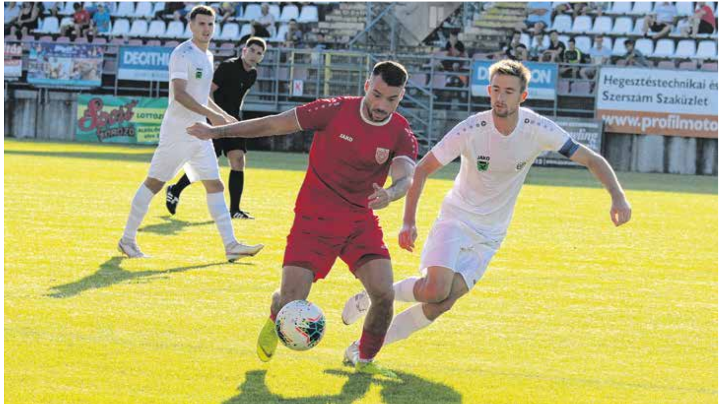
Az SC Sopron az elmúlt héten is kettő mérkőzést játszott. Felvételünk a Tatabánya elleni, hazai vereséggel végződő meccsen készült.

A héten egy meccs vár a játékosokra. A szombati játéknapon 17.30-as kezdéssel a tabella 3. helyén lévő VLS Veszprém lesz az ellenfél. A Veszprém megyei klub az eddig lejátszott hét mérkőzésből öt győzelmet,