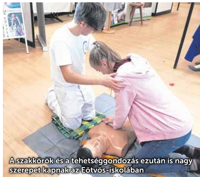
A szakkörök és a tehetséggondozás ezután is nagy szerepet kapnak az Eötvös-iskolában

Mivel a tehetségpont cím elnyerése után szinte azonnal bevezették a járványügyi korlátozásokat, az érdemi munka még csak most következik. A meglevő szakköröket és vetélkedőket a tanárok igyekeznek beépíteni a programba, és kiszűrni, melyik diák miben jó. Mindezt a pályaelemzésrel együtt valósítják meg.