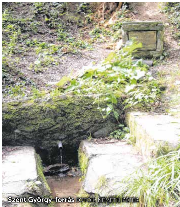
Szent György-forrás