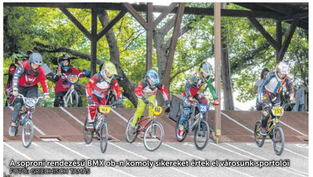
A soproni rendezésű BMX ob-n komoly sikereket értek el városunk sportolói

Az állás betölthető az elbírálást követően azonnal.