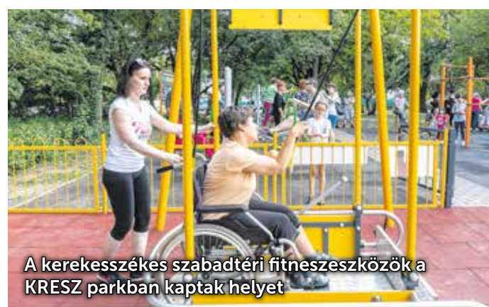
A kerekesszékes szabadtéri fitnesseszközök a KRESZ parkban kaptak helyet