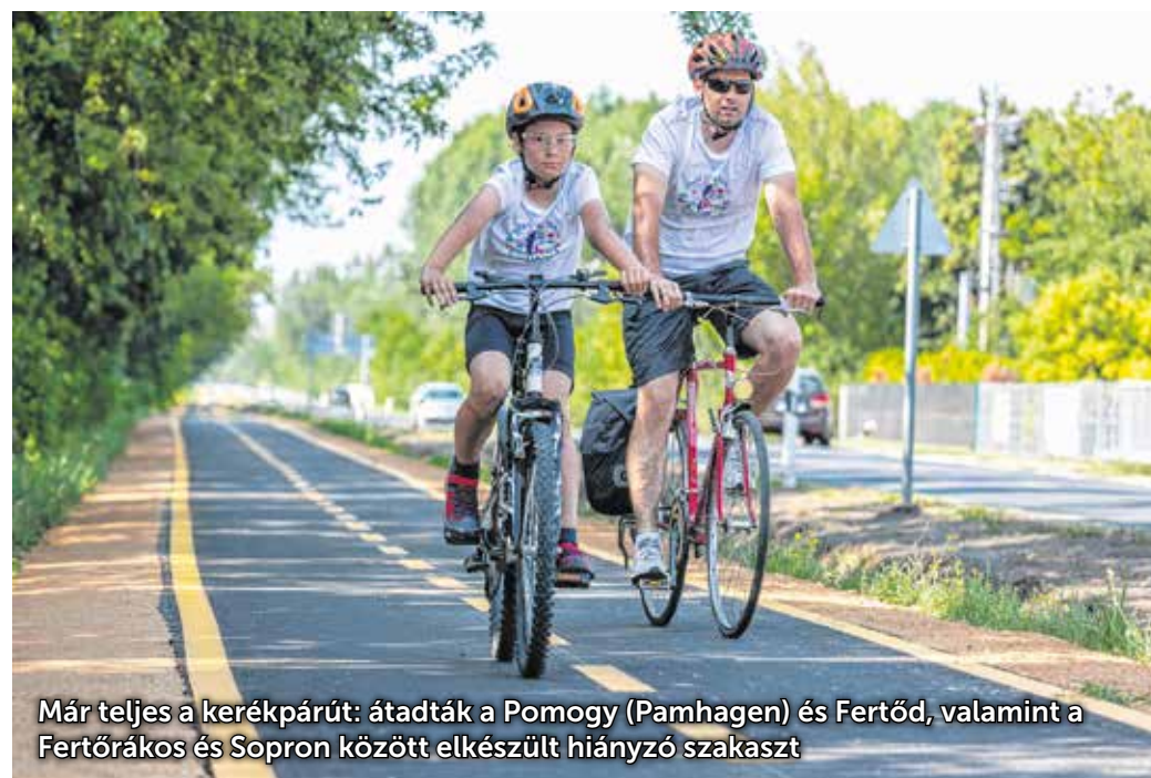
Már teljes a kerékpárút: átadták a Pomogy (Pamhagen) és Fertőd, valamint a Fertőrákos és Sopron között elkészült hiányzó szakaszt