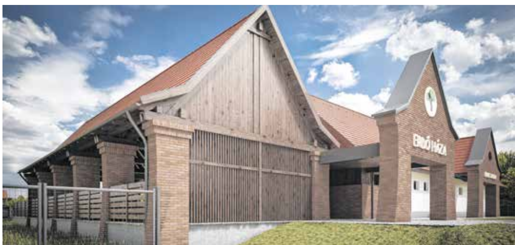
Az ökoturisztikai központ látványterve – már dolgoznak a Muckon, a tervek szerint jövő májusra készül el a látogatóközpont