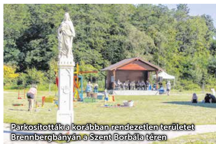
Parkosították a korábban rendezetlen területet Brennbergbányán a Szent Borbála téren

Átadták a mintegy hatszázmillió forintból felújított Pomogy (Pamhagen) és Fertőd, valamint a Fertőrákos és Sopron között elkészült hiányzó kerékpárútszakaszt, így a Fertő tó körül teljes a bicikliút-hálózat. Az ünnepségen Barcza Attila, a térség országgyűlési képviselője Révész Máriausz aktív Magyarországiért felelős kormánybiztossal, valamint a környék polgármestereivel kerékpározott Pomogytól Fertőrákosig. A fejlesztés azért is fontos, mert a térségben százezrek fordulnak meg kerékpárral évente.