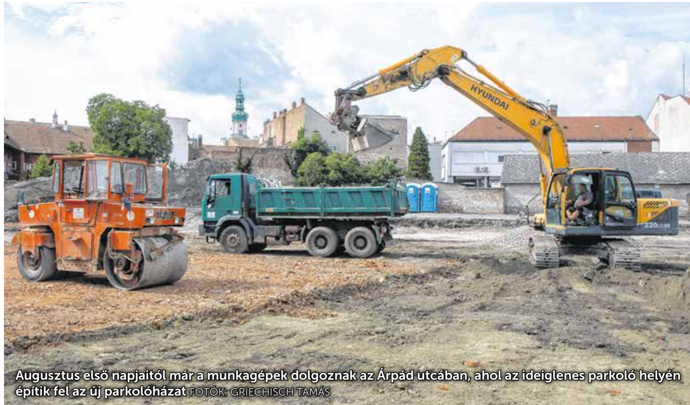
Augusztus első napjaitól már a munkagépek dolgoznak az Árpád utcában, ahol az ideiglenes parkoló helyén építik fel az új parkolóházat

Felavatták az első soproni kerekesszékes szabadtéri fitnesseszközöket a KRESZ parkban. A két gép építését a Hova Tovább Közhasznú Alapítvány európai