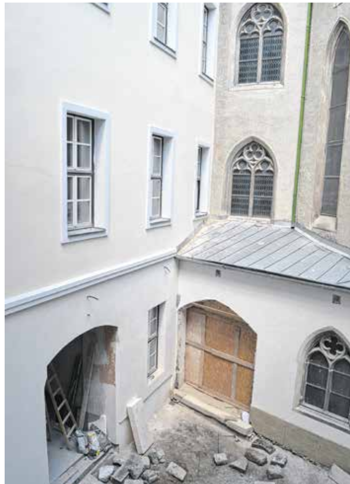
Az iskola belső homlokzatai is megújultak

A Szent Orsolya Gimnázium teljes körű rekonstrukciójának első üteme 2016-ban zárult, ekkor adták át az új 3. emeletet. Ezt követően zajlott a villamoshálózat-korszerűsítés, a hőszigetelés és a nyílászárócsera az Orsolya téri épületben. A felújítás aktuális üteme januárban kezdődött,