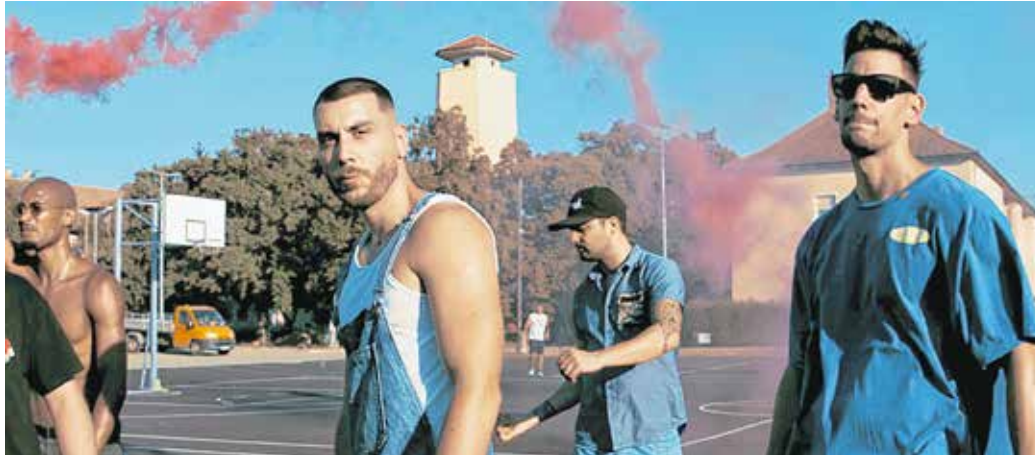
Legújabb klipjét Sopronban és Fertőd sütőri részén forgatta Curta

– A legfőbb soproni szál az egyik élelmiszerbolt-hálózat, ami Sopronnak egy sajátossága. Sokat járok oda, és szerintem jól hangzik a bolt neve, ezért belefűztem a szövegembe. Azt gondoltam, jól mutatna a klipben is, ezért felkerestem az üzemeltetőket, akik nyitottak voltak az ötletre és zárás után rendelkezésünkre bocsájtották az egyik üzletet. Szerintem szuper felvételek készültek.