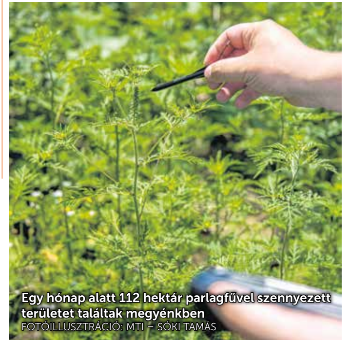
Egy hónap alatt 112 hektár parlagfűvel szennyezett területet találtak megyénkben

A lakosság szempontjából a védekezés legegyszerűbb módja, ha gyökérzettel együtt kihúzza a növényt a talajból. Ha mindenki csak egy-egy tő parlagfűvet távolít el még a virágzás előtt, akkor már sokat tettünk az allergia és a parlagfűszennyezés megszüntetése érdekében. Ha valaki parlagfűvel szennyezett területeket észlel, maga is jelentheti ezt a hatóságnak e-mailben, vagy használhatja a Parlagfű Bejelentő Rendszert, amely a https://pbr.nebih.gov.hu címen közvetlenül elérhető.