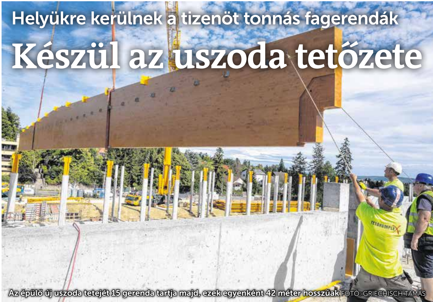
Az épülő új uszoda tetejét 15 gerenda tartja majd, ezek egyenként 42 méter hosszúak