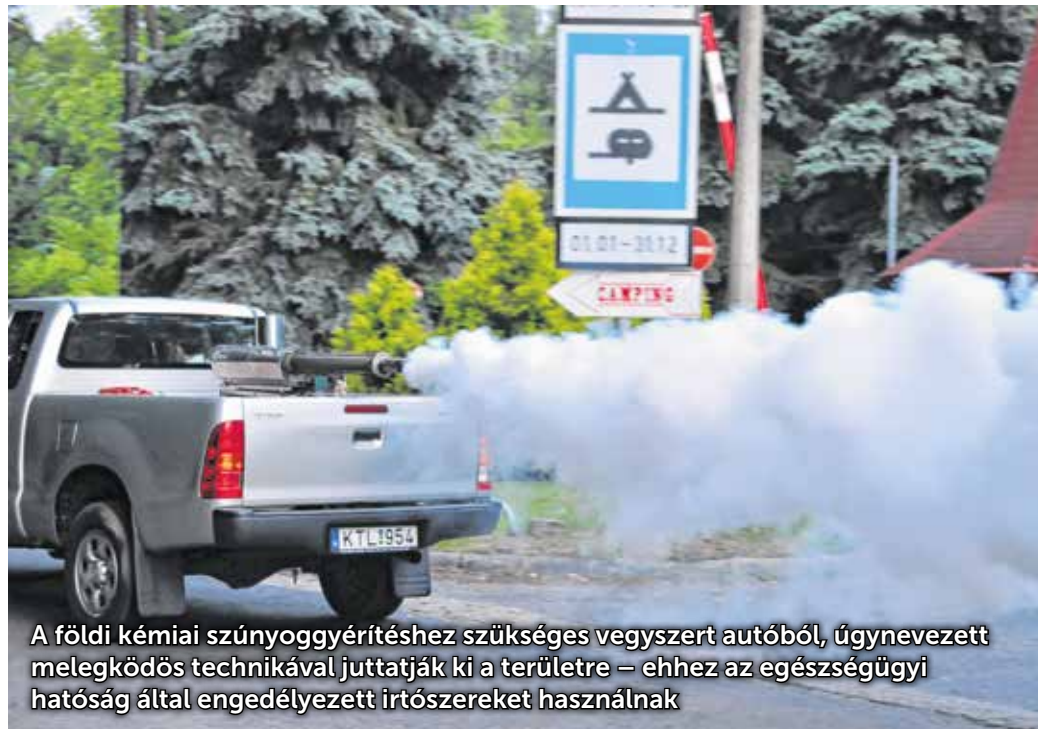
A földi kémiai szúnyoggyérítéshez szükséges vegyszert autóból, úgynevezett melegködös technikával juttatják ki a területre – ehhez az egészségügyi hatóság által engedélyezett irtószereket használnak

A földi kémiai szúnyoggyérítéshez szükséges vegyszert napnyugtától gépjárművel juttatják a környezetbe. A kezelésekhez kizárólag az egészségügyi hatóság által engedélyezett irtószerek használhatók, melyek hatóanyagát az Európai Unió közös eljárásban hagyta jóvá, azonban az egyszerű elővigyázatosság indokolt. A szabadon tárolt gyerekjátékokat, élelmiszereket, evőeszközöket, a szabadban szárított ruhákat javasolt összegyűjteni vagy letakarni. A kezelés idején és az azt követő egy órában javasolt az ablakokat, ajtókat zárva tartani, és a külső levegőt