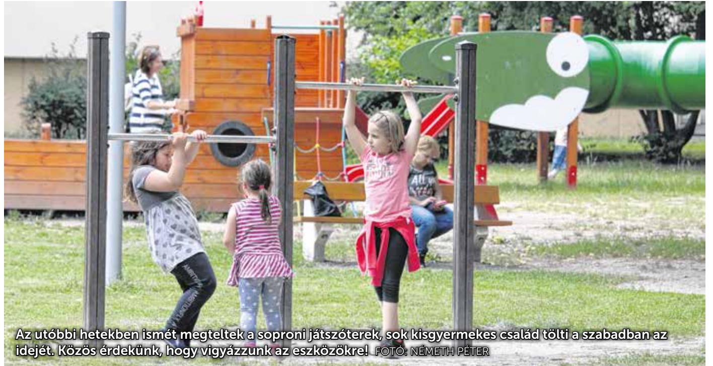
Az utóbbi hetekben ismét megteltek a soproni játszótérek, sok kisgyermekes család tölti a szabadban az idejét. Közös érdekünk, hogy vigyázzunk az eszközökre!

A soproni önkormányzat összesen harminchat játszótéren biztosítja a kisgyerekek, kisiskolások kikapcsolódását. A játszótéret kisgyermeknek építették, esetenként több millió