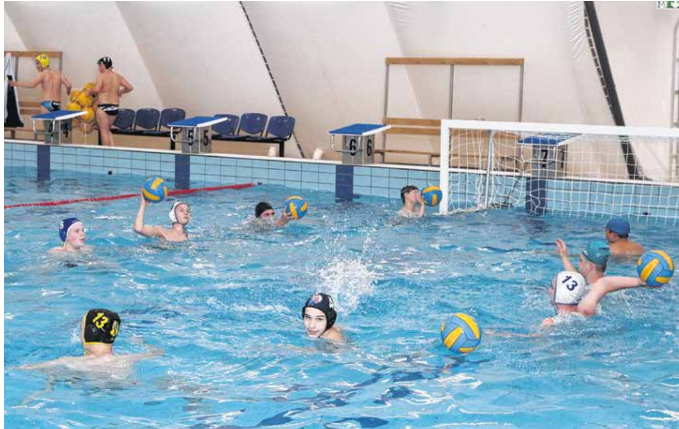
A soproni pólósok ismét visszazoknak a vízhez, júliustól pedig már tornákon is indulnak

– A sportolóknak már május második felétől volt lehetőségük arra, hogy szigorú időszakok szerint használják az uszodát – tette hozzá a vezetőedző. – Nekünk ez az időszak különösen jó volt, hiszen csak mi voltunk a medencében, kényelmesen tudtunk edzeni. Tartottunk attól, hogy mennyire esett vissza a gyerekek állapota, azonban szorgalmasak voltak a vízmentes időszakban is, így „csak” a vízhez kellett visszazokniuk. Hosszabb úszásokkal, sok labdás feladattal próbáltuk visszahozni az állóképességüket, mára úgy néz ki, hogy sikerült. Inkább a játékos feladatokon, labdatechnikán van a hangsúly,