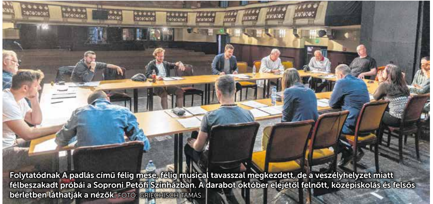
Folytatódnak A padlás című félig mese, félig musical tavasszal megkezdett, de a veszélyhelyzet miatt félbeszakadt próbái a Soproni Petőfi Színházban. A darabot október elejétől felnőtt, középiskolás és felsős bérletben láthatják a nézők.

A Soproni Petőfi Színház 2019–20-as évadára bérletet váltó nézők az elmaradt bemutatók helyett a Mesés musicalek című előadást tekintheti meg a fertőrákosi barlangszínházban. Az előadás regisztrációköteles, ezért kéri, hogy keressék a jegyirodát!