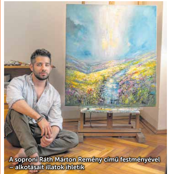
A soproni Ráth Márton Remény című festményével – alkotásait illatok ihletik

A fiatal művész tele van tervekkel, ezek között szerepel egy olyan egyéni kiállítás, ahol a festményeit ihlető illatokat is megismerheti majd a közönség.