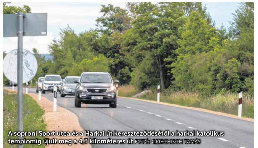
A soproni Sport utca és a Harkai út kereszteződésétől a harkai katolikus templomig újult meg a 4,3 kilométeres út

– Útfelújítási program részeként valósul meg a Sopront Harkával összekötő út teljes felújítása – mondta Barcza Attila, Sopron és térsége országgyűlési képviselője az elmúlt héten a helyszínen tartott sajtótájékoztatóon. – Harka lakossága meghaladja a 2800 főt, valamint az ingázók közül is sokan erre autóznak. Országgyűlési képviselőként fontos számomra, hogy biztonságosabbá tegyük a közlekedést. A városba be- és kivezető utak felújítása a program keretében valósul meg. Tavaly adtuk át a Sopron és Ágfalva közötti utat, de folyamatban van, mintegy hat kilométer hosszban a Fertő-parti út Sopron és