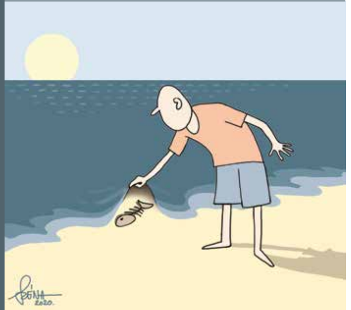
Szénási Ferenc (Széna) soproni karikaturista alkotásai hétről hétre.