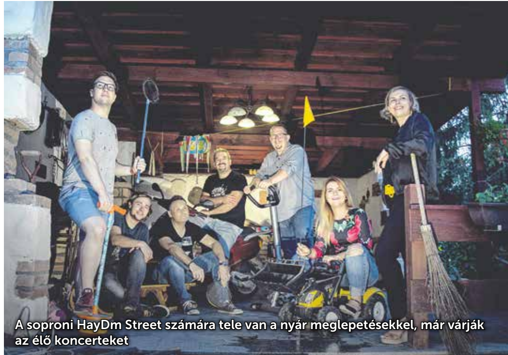
A soproni HayDm Street számára tele van a nyár meglepetésekkel, már várják az élő koncerteket

– Még január végén rögzítettünk egy koncertet a Búgócsigában. Nem sejtettük akkor, hogy egy jó ideig nem fogunk muzsikálni a nyilvánosság előtt, és az elkövetkezendő néhány hónapban gyakorlatilag ezek a felvételek jelentik a kapcsolatot a közönségünkkel. Februárban nekiláttunk a felvett anyag utómunkálatainak, és a vírusidőszak előtt el tudtuk kezdeni a vágásokat. Ekkor készült el nagyjából tíz dal, amelyekről úgy gondoltuk, hogy minden pénteken „adagoljuk” a publikum