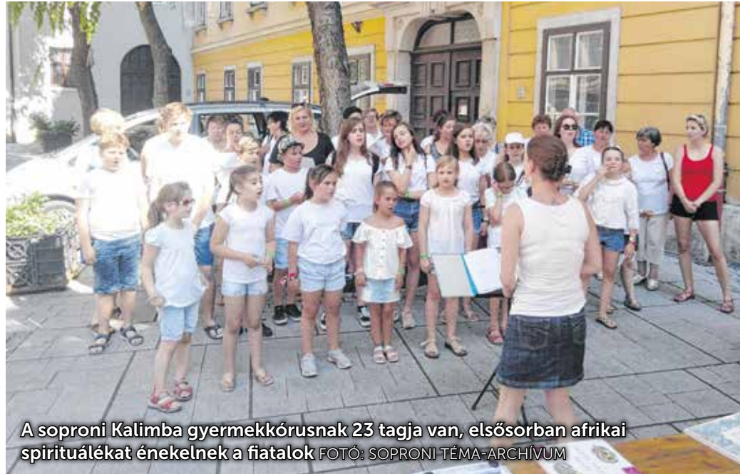
A soproni Kalimba gyerekkórusnak 23 tagja van, elsősorban afrikai spirituálékat énekelnek a fiatalok

– A részleges karantén alatt Skype-on tartottam a Kalimba órákat, négyfős csoportokra osztottam a kicsiket. Számomra egy kicsit fárasztó volt, hogy a heti egy alkalomból 6 lett, de a gyerekek nagyon hálásak voltak, és ez lelkesített engem is. Ezen kívül heti egyszer élő online órát tartottam nekik. Ugyanúgy tanultak hangképzést, új dalokat, koreográfiát is. A gyerekkórus