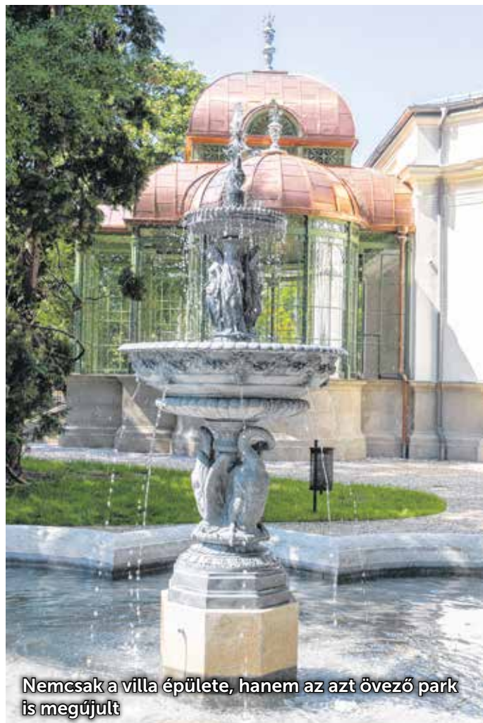
Nemcsak a villa épülete, hanem az azt övező park is megújult

– A Modern Városok Program azért is fontos városunk számára, mert a sokmilliárdos fejlesztések mellett nemcsak egy gyorsforgalmi utat hoz el