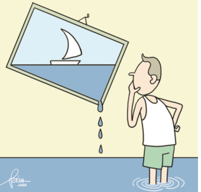
Szénási Ferenc (Széna) soproni karikaturista alkotásai hétről hétre.