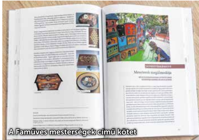
A Faműves mesterségek című kötet