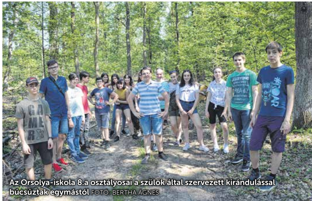
Az Orsolya-iskola 8.a osztályosai a szülők által szervezett kirándulással búcsúztak egymástól.

Országwide elkezdődtek az általános iskolai ballagások. Idén viszont nem tudunk egymás vállát fogó, virágokat szorongató, meghatott arcú diákokat fotózni. És nem azért, mert elromlott a gépünk... Az oktatási intézményekben szigorú óvintézkedések mellett tartják (tartották) meg az ünnepeket, de van olyan iskola is, ahol csak online, interneten keresztül búcsúznak el a pedagógusok a diákoktól. A Soproni Tankerületi Központ azzal a kéréssel fordult az iskolák felé, hogy a helyzetre tekintettel az idejében iskolai