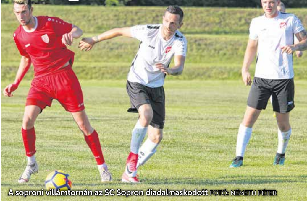
A soproni villámtornán az SC Sopron diadalmaskodott