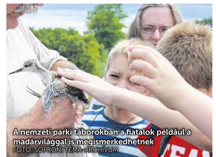
A nemzeti parki táborokban a fiatalok például a madárvilággal is megismerkedhetnek