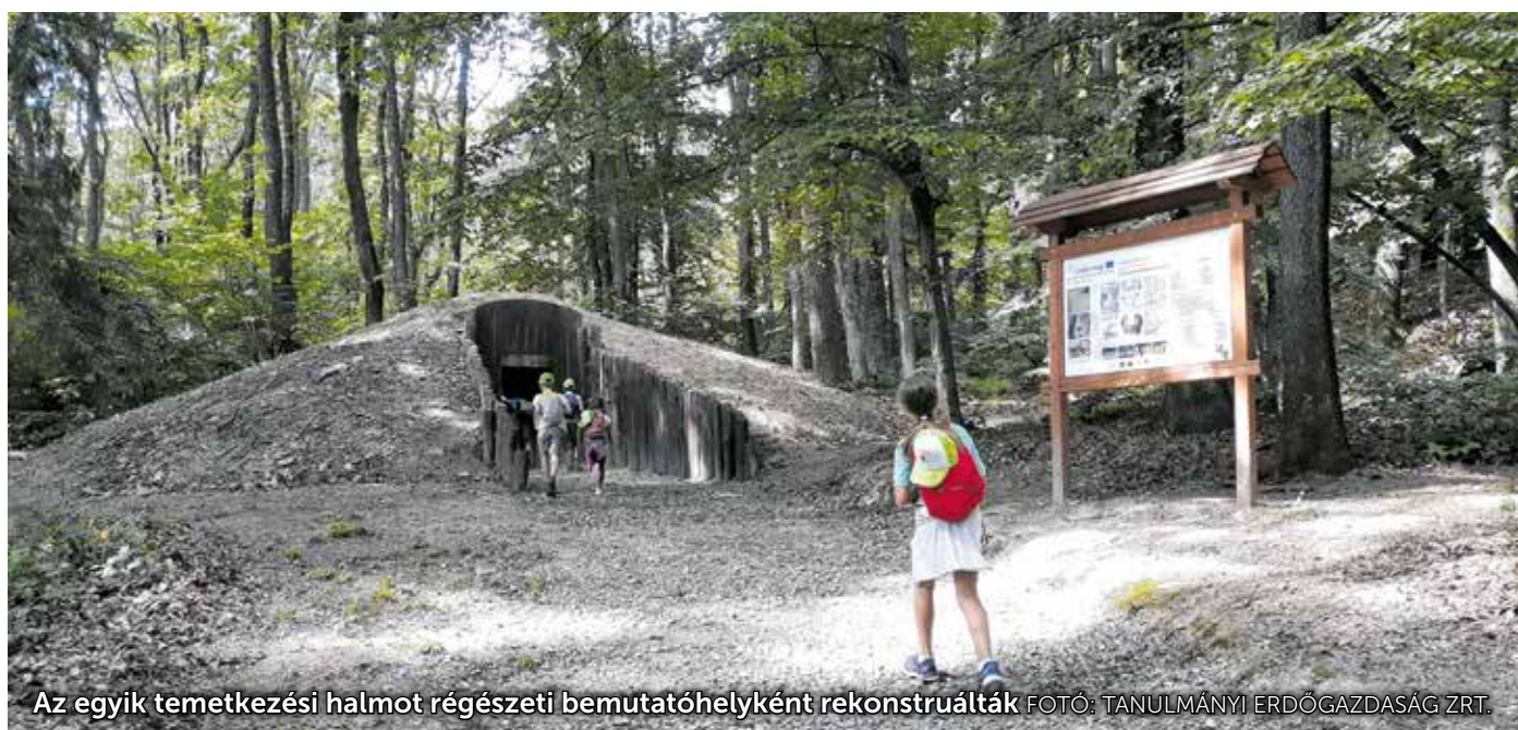
Az egyik temetkezési halmot régészeti bemutatóhelyként rekonstruálták