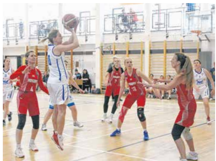
Izgalmas meccseket hozott a városunkban rendezett kosárlabdatorna.