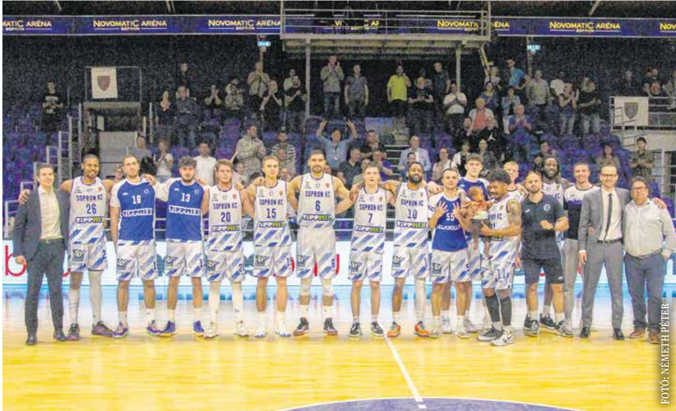
- A Debrecen elleni két győzelmével ismét megmutatta jó karakterét, igazi arcát a csapat - mondta Baksa Szabolcs másodedző.