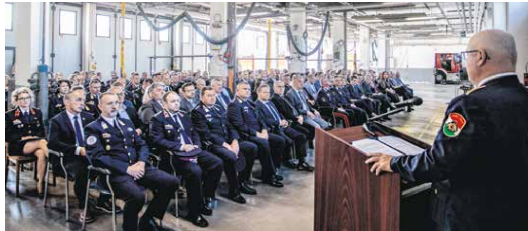
A megyei ünnepségen díjazták a soproni tűzoltókat is.