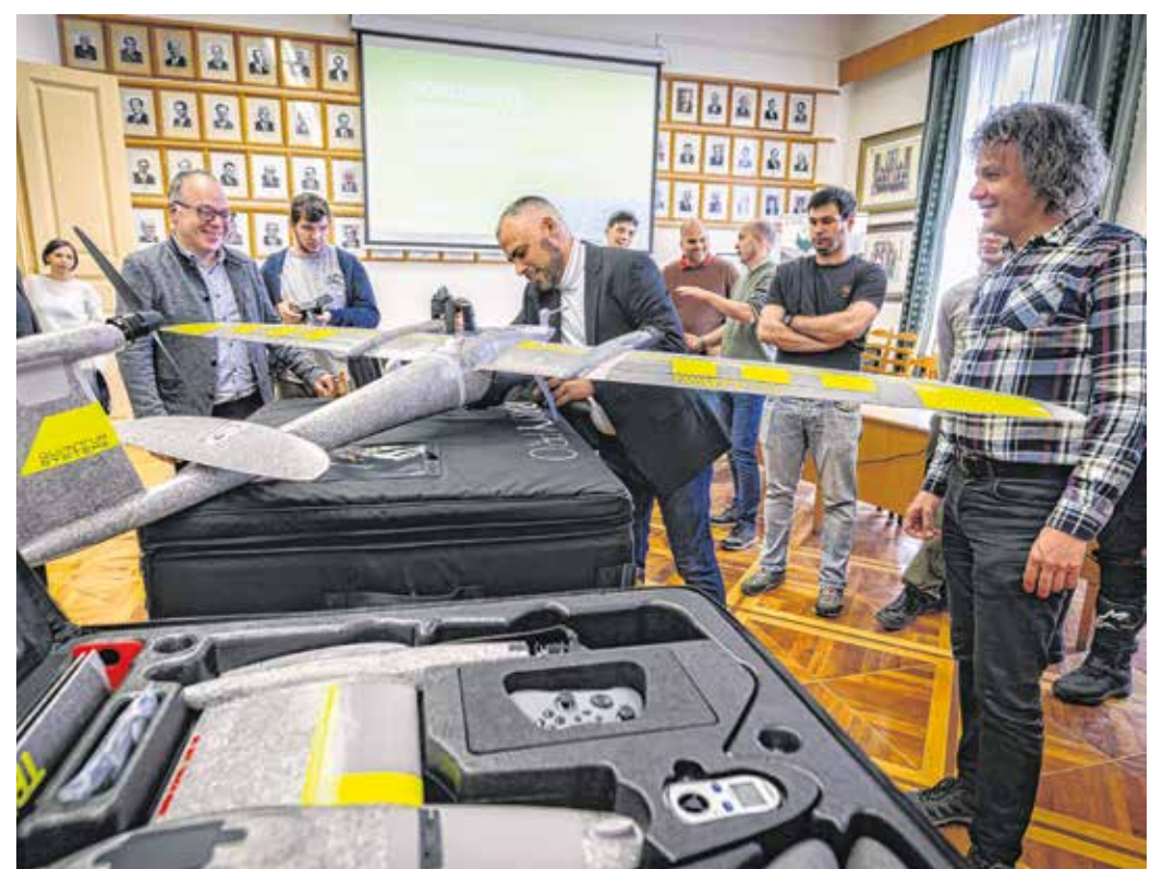
A két drón együttes használatával egy soproni-hegyvidéki, 4000 hektáros területet egy nap alatt tudnak felderíteni a szakemberek.

A drónok mozgásukban is különböznek a boltokban is kapható társaiktól. – Fügőlegesen szállnak fel, mint egy helikopter, de úgy repül-