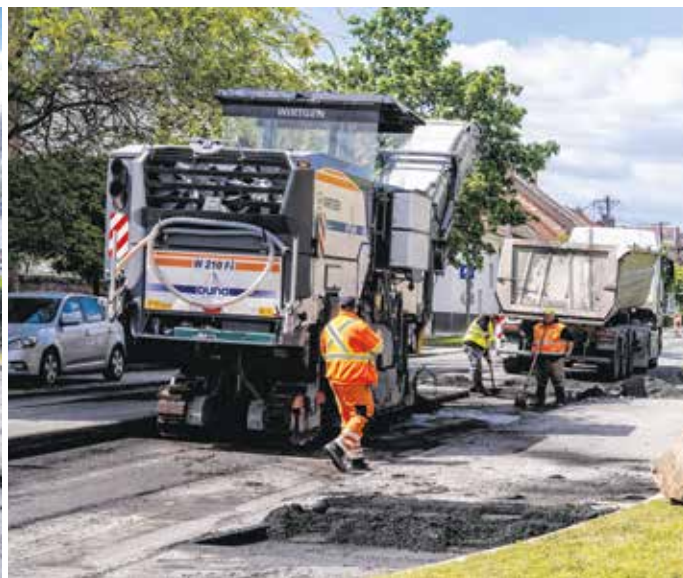
A Kőszegi út és Mátyás király utca közötti szakaszon már dolgoznak a szakemberek.