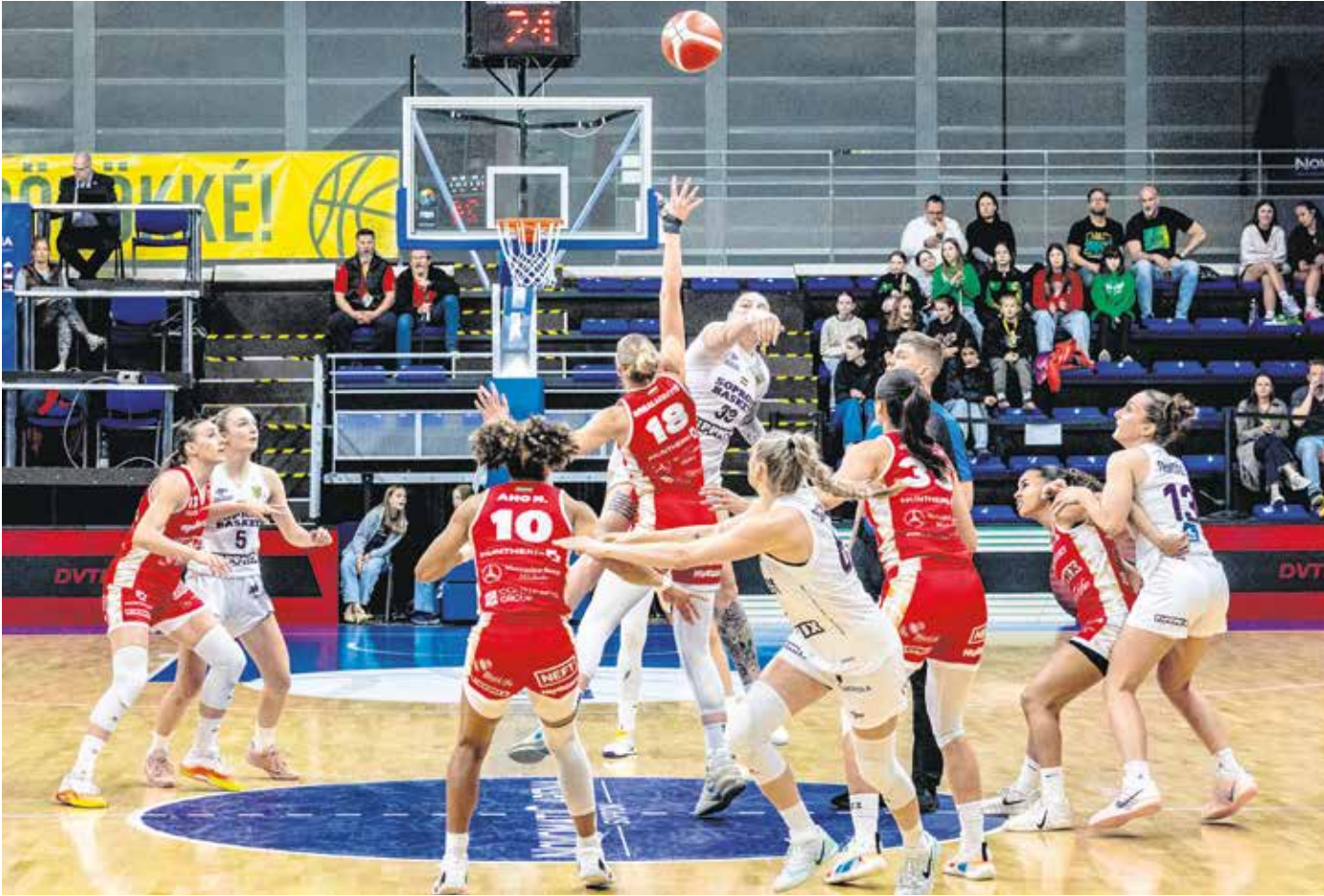
Az idegenbeli vereség után a második meccsen győzni tudott hazai pályán a Sopron Basket, azonban a mindent eldöntő harmadik összecsapáson végül a DVTK kerekedett felül.