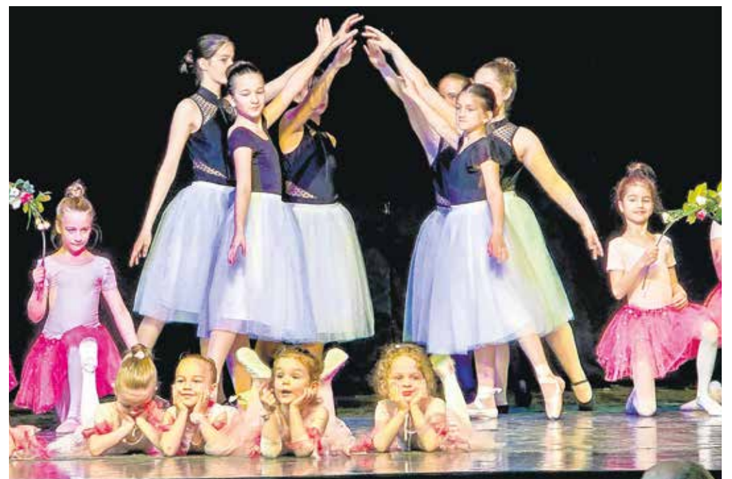
A GYIK Rendezvényházban gyermek- és felnőtt táncgyüttesek egyaránt bemutatkoztak.

A rendezvényen gyermek- és felnőtt táncgyüttesek egyaránt bemutatkoztak. A fellépők között többféle stílus képviselői is helyet kaptak, így a közönség a klasszikusabb formák mellett modernebb műfajokkal is találkozhatott. Az idei műsorban például a legyezőtánc mellett a hip-hop is felbukkant már az első produkciók között. A rendezvény egyik vezérgondolata, hogy a tánc az emberi kultúra egyik legősibb formája: ahol megszólal