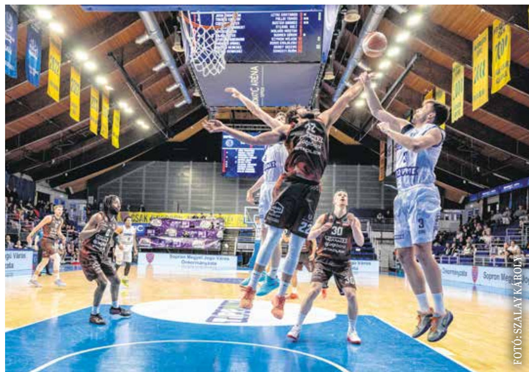
A bajnoki címvédő Szolnok elleni párharcban tartalékosan, szűk rotációval játszott az SKC.