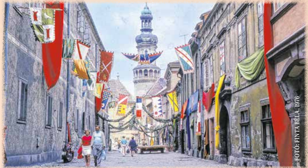
Sopron szépsége filmbe illő – A koldus és királyfi című film forgatásának helyszínéeként.