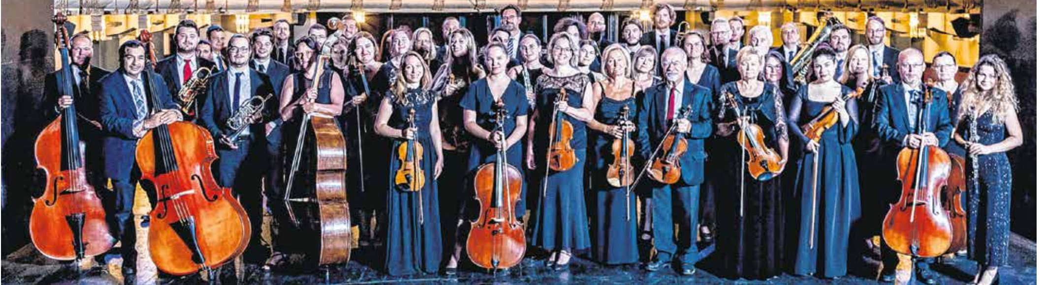
A koncertek állandó fellépői a soproni szimfonikusok, akik mellett az egyes előadásokon vendégművészek is szerepelnek a Liszt-központban.