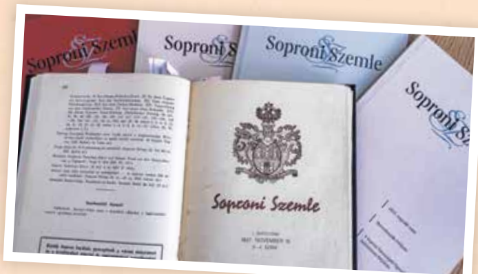
A Soproni Szemlét 1937-ben alapította a Soproni Városszépítő Egyesület.

Mindeközben a felesége, Marika, titokban egy online pszichológiai fórumon tesz fel kérdést Dezső Szemle-függőségéről, és megtudja: erre nincs orvosság. Aki egyszer Sopronnal fertőződött, az így is fog a sírba szállni!