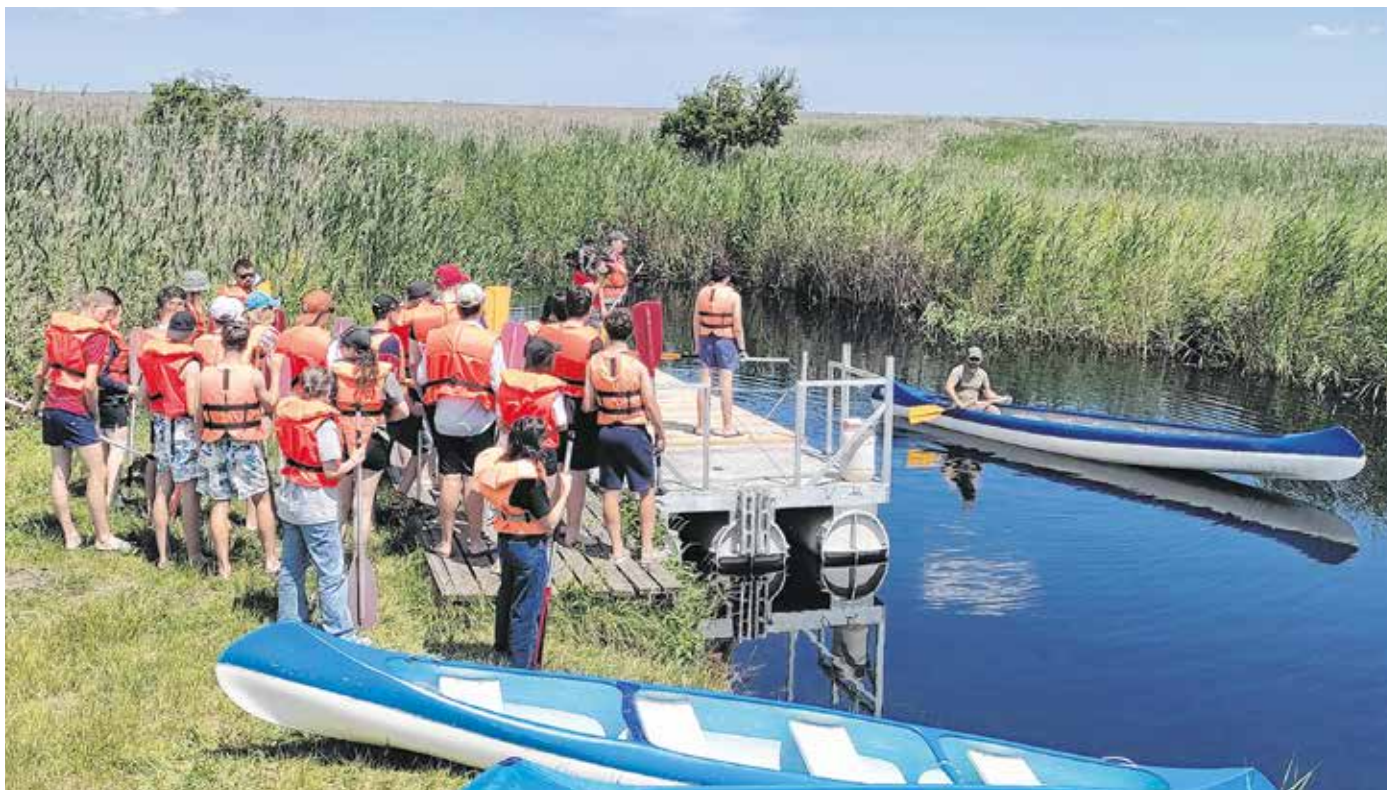
Tavaly rendkívül népszerűek voltak a Fertő-Hanság Nemzeti Park kenutúrái, ezek során a Fertő nyugati oldalán a nádasok, a csatornák és a belső tavak élővilágát mutatják be.