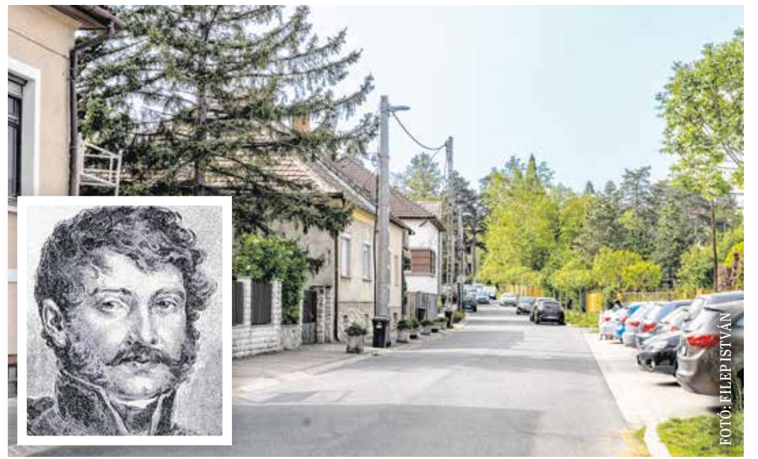
A Hunyadi János utca és a Bajcsy-Zsilinszky utca között húzódik a Berzsényi Dániel utca.

A városias beépítésű Alsólővérek városrészben, a Hunyadi János utca és a Bajcsy-Zsilinszky utca között húzódik a Berzsényi Dániel utca. Korábban itt volt a Meyne-féle faiskola. 1927-ben kapta a nevét, több utcát nevezték el ekkor híres költőinkről a környéken. Ugyan indultak kezdeményezések az épített környezet helyi védelmében, de a rendelettervezet elkészülte alatt sok védelemre javasolt épület elpusztult. Ilyen volt a Berzsényi Dániel utca 5. szám alatti ház. Abban is különbözik a környező utcáktól, hogy szelölősebben épült be szabadon álló házzal. Az 1969-es légi felvétel alapján a 7. számú társasház helyén is csak üres telkek álltak a Doborjáni utcával közös sarkon. Az egykori Liceumi Diákotthon, röviden „LiDo” kétemeletes épületének tőzsomszedságában saját lélatós sportpályája és kertje volt, mely az utca északi oldalán húzódott, így az