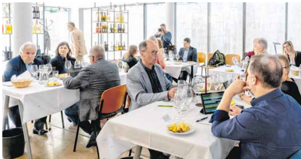
A bírák a nedűk tisztaságát, illatát, ízét, harmóniáját és színét is pontozták a pénteki 2024-es Soproni borvidéki borversenyen.