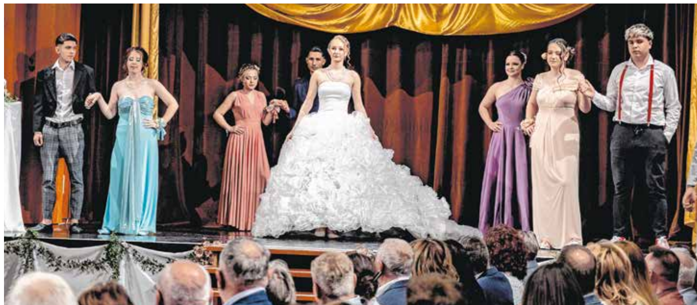
Az idei Handler-divatgála témája az esküvő volt – ez ihlette alkotásra a fiatalokat.