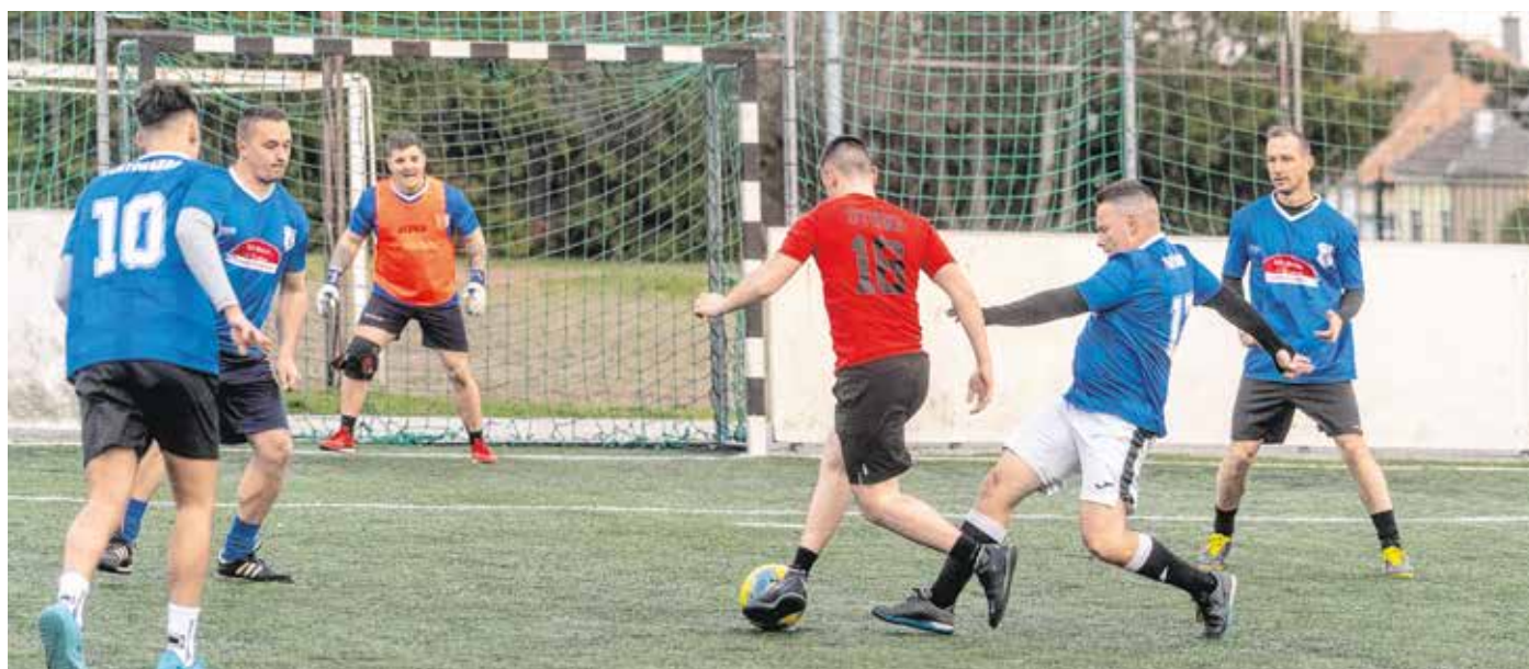
Idén is tavasszal sorolták osztályokba a kispályásfoci-bajnokság csapatait.

A sportszakember hozzátette: a jereváni pályákon már nem rendeznek mérkőzéseket, a csapatok a Halász Miklós Sporttelep két műfüves pályáján játszanak hétről hétre.