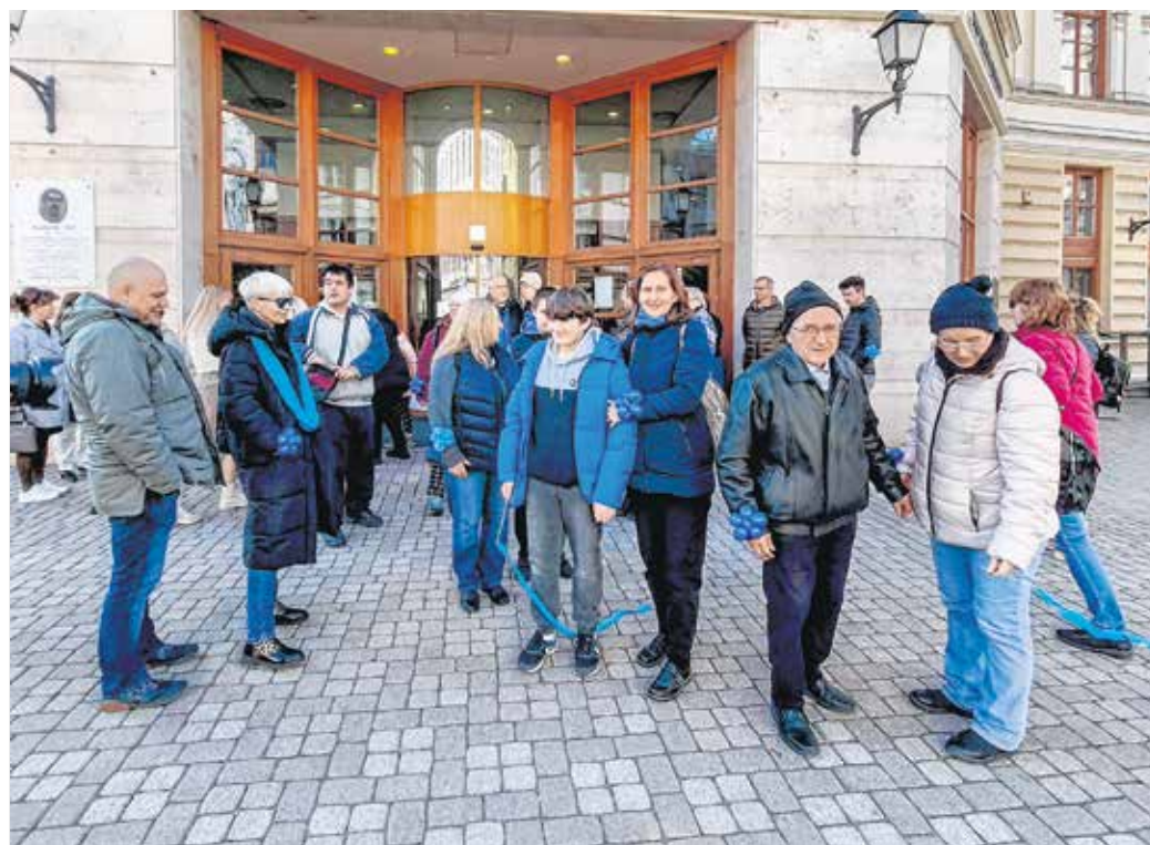
Idén is sokan csatlakoztak a kék sétához, amely a Liszt-központ elől indult.

A rajzpályázatra idén százharminc alsó és felső tagozatos diák, valamint óvodás gyermek munkája érkezett – őket díjazták. A szervezők a pedagógusok munkájára is szeretnék ráirányítani a figyelmet, hiszen ők rendkívül sokat tesznek az autista gyermekekért. Különdíjjal