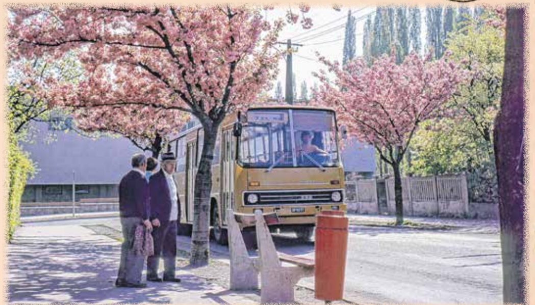
Virágzó japán cseresznyefák a Lovérekben.

Szeretném most bemutatni a fotósok leggyakrabban típusait, akikkel ezen a „harc téren” találkozhatunk. Az első és legfélelmetesebb csoport a „felszereléskommandósok”. Ők azok, akiknek a fényképezőgépe többé kerül, mint egy használt autót. Hatalmas állványokkal érkeznek, amiket a legszűkebb ösvények közepén állítanak fel, eltorlaszolva a forgalmat. Az arcukon mély megvetés látszik mindenki iránt, aki „csak” telefonnal fotóz. Órákig képesek egyetlen virágot bámulni, várva a „tökéletes fényre”, ami természetesen pont akkor tűnik el, amikor végre lenyomná a gombot.