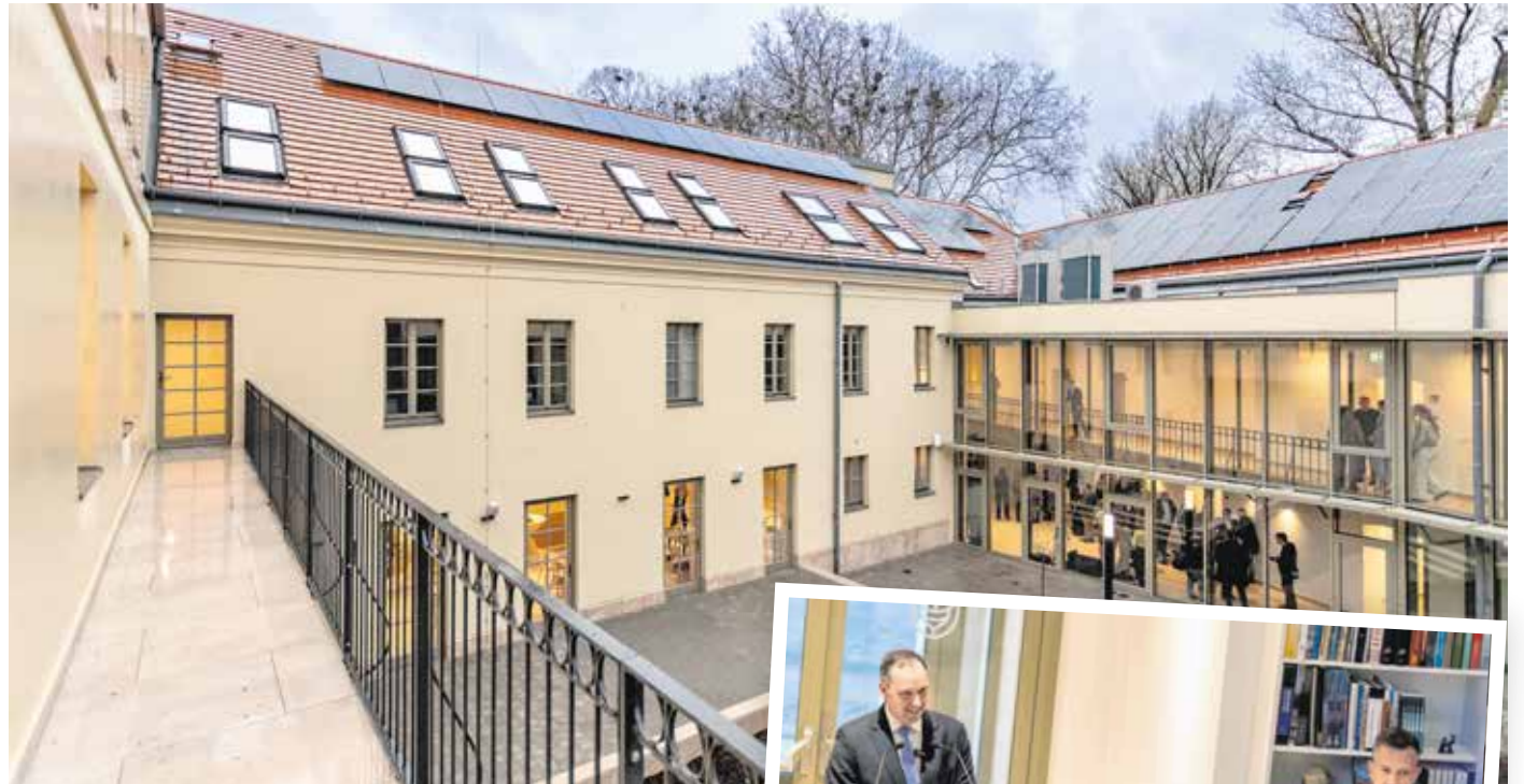
A modern létesítményben helyet kapott egy 56 fős kollégium, torna- és előadóterem, irodák is.

– Bár a TAO-rendszer gyakran támadások kereszttüzébe kerül, de pont ennek a finanszírozási rendszernek a fenntartása lehet a biztosítéka annak, hogy a magyar utánpótlás továbbra is