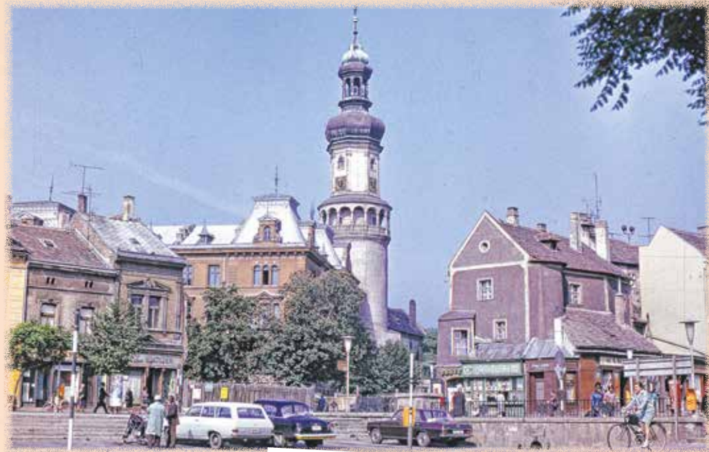
A Várkerület 1974 körül.

Próbáltam felvenni a „mindentudó múzeumi szakki” arckifejezést, mintha röntgenschemmel látná a római kori leleteket a macskakő alatt (spoiler: fogalmam sincs, mi van ott). Erre a harminc nyugdíjas szinkronban