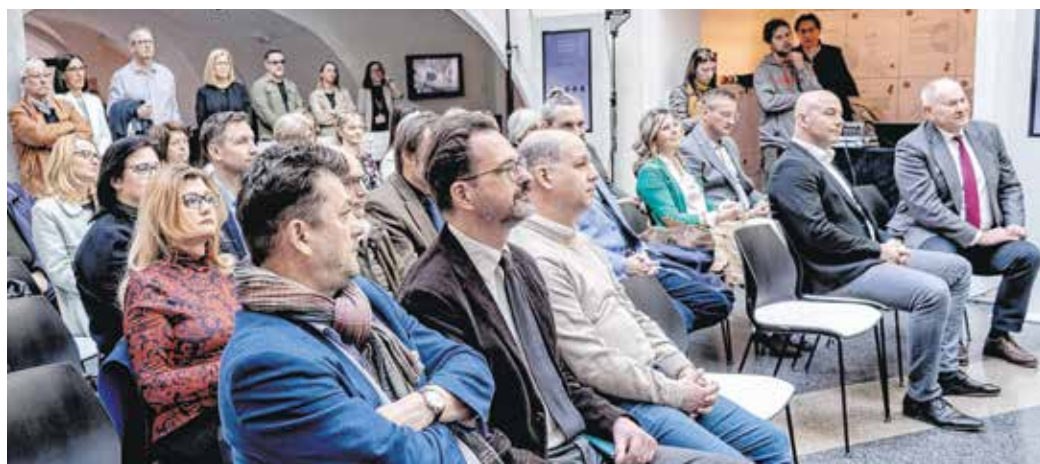
A Sopron – Egy közösség története című kötetet a múzeumnegyedben mutatták be.

A könyv már kapható a Tourinform Sopron irodájában és a múzeumnegyed összes üzletében.