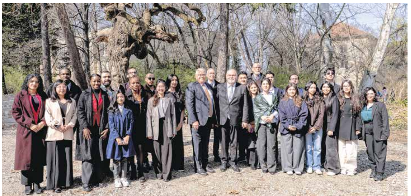
Azerbajdzsán nagykövete és a delegáció közös sétát tett a Soproni Egyetem botanikus kertjében.