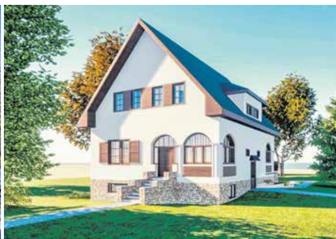
A Kakasos ház napjainkban (b) és felújítás után a látványterven (j). Jövő év második felében nyitja meg kapuit.