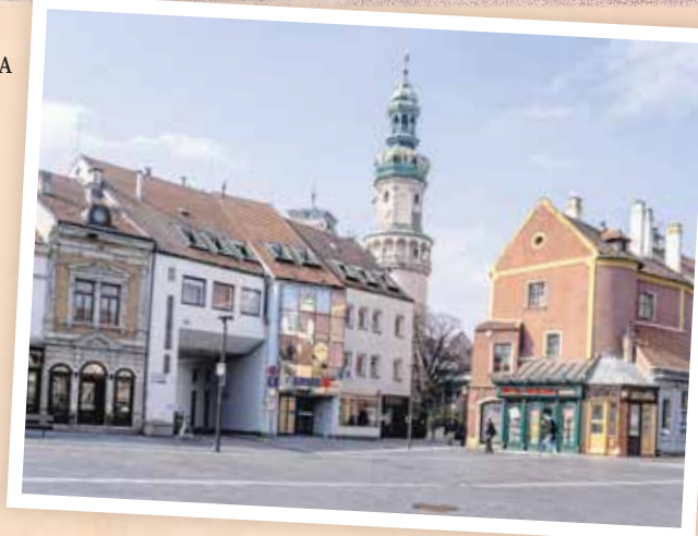
A városközpont napjainkban.

Hogy őshonos soproni vagyok-e? Itt születtem, de ez nem jelent semmit. Ez egy érzés. Az a megnyugtató tudat, hogy a belvárosban sosem lehetek névtelen idegen. Az embereknek még van idejük és szívük egymásra. És amíg van kinek köszönni az Előkapuban, addig büszkén vállalom a „sétáló turistalátványosság” szerepét.