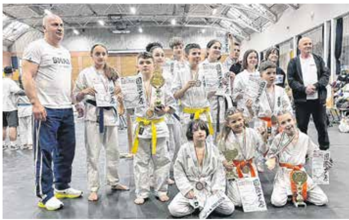
A soproni Waido Fight Academy 14 fős csapattal érkezett a győri versenyre.

Szép sikereket értek el a soproni Waido Fight Academy versenyzői Győrben. Hétvégén rendezték meg a Győri Ashihara kategála – Dana Kupát, ahol négy ország – Magyarország, Szlovákia, Románia és Ukrajna – 236 versenyzője mérte össze tudását. A rangos eseményen 21 egyesület vett részt, hat különböző küzdősportstílusban tartottak összecsapásokat.