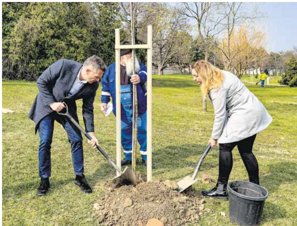
A Kőszegi úti aluljáró környékén 12 fát ültettek el.