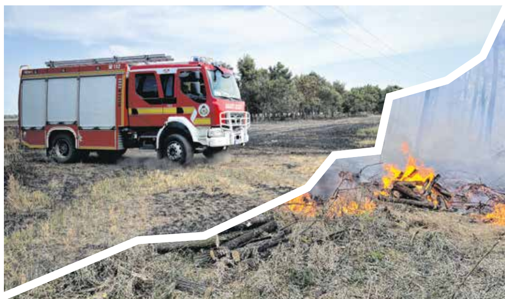
A szabadtéri tüzek túlnyomó többsége emberi tevékenységhez köthető, 99 százalékát gondatlanság vagy figyelmetlenség okozza.

A hatályos jogszabályok szerint a növénytermesztéssel összefüggésben keletkezett hulladék szabadtéri égetése – ha a jogszabály másként nem rendelkezik – tilos. Belterületen növényi, például avar vagy kerti hulladék égetésére csak akkor van