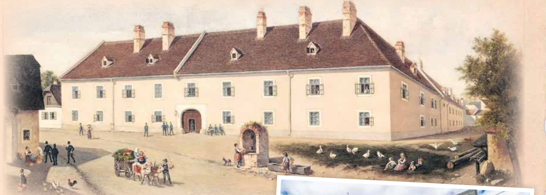
Az egykori Halász laktanya, ma a Petőfi-iskola áll a helyén (Halász utca 25.). FESTMÉNY: HAUSER KÁROLY, 1908., SOPRONI MÚZEUM.

A magyar költőóriás, Petőfi Sándor életművét talán senkinek nem kell bemutatni. Nyelvünk és hagyományaink őrzése, nagyjaink emlékének ápolása segíti nemzeti identitásunkat, összetartozásunkat erősíteni. A volt Halász kaszárnya (Halász utca 25.) az egyik olyan épület, amelyet a szabadságharc költője által ott eltöltött idő tett – többek között – emlékhellyé. Hogy jobban megidézhessük a hely szellemét, segítségül hívhatjuk Hauser Károly festményét, aki 1908-ban vetette papírra az egykori laktanyaépületet.