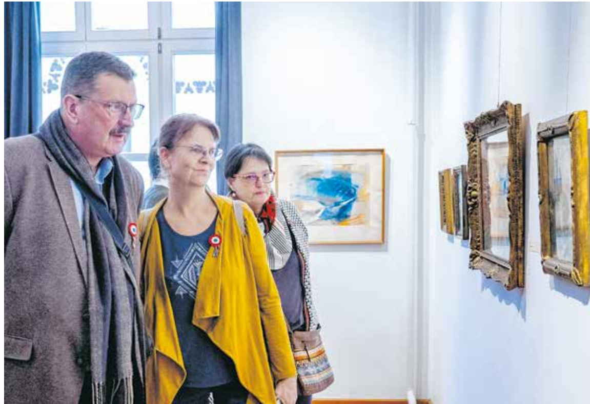
A falakon látható képek könnyednek ható, légies akvarellek – annak ellenére, hogy alkotóik számos történelmi és családi tragédiát éltek át.