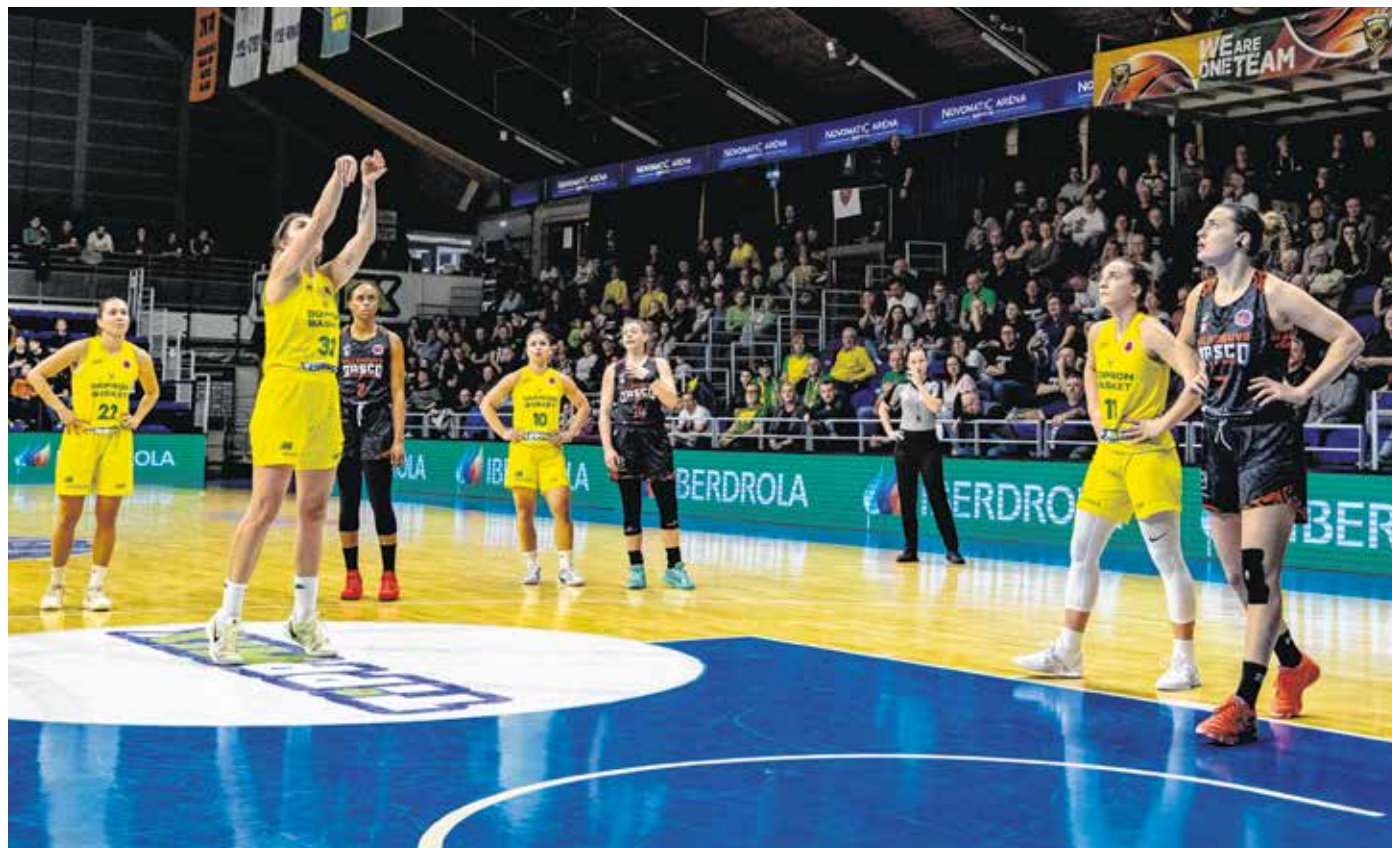
A Sopron Basket hazai pályán (felvételünkön) és idegenben is kikapott az Európa Kupában a Villeneuve-től.

– A Montpellier ellen sikerült továbblépni, a Villeneuve viszont jobbnak bizonyult. Mi volt