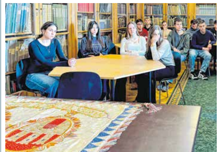
A rendhagyó órán bemutatták a Széchenyi-gimnázium évtizedekkel ezelőtt elkészült zászlóját is. FOTÓ ÉS SZÖVEG: LAKLIA-SZILÁGYI ANDREA

A levéltár pedagógiai órái ingyenesek, tartanak egyéni foglalkozásokat szabadon választott témakörökben kicsiknek és nagyoknak egyaránt.