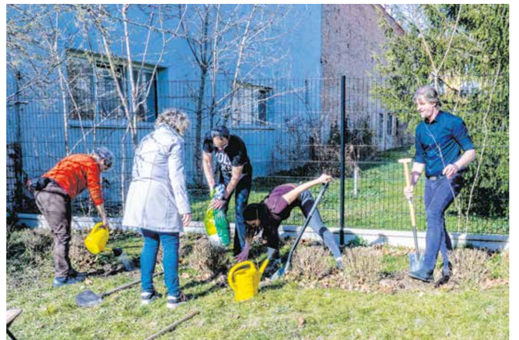
Mirabella fajtájú fákat ültettek múlt héten a Lenck-villa kertjében.