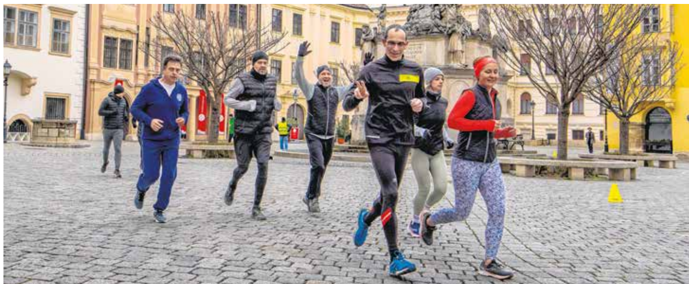
A hűvös idő ellenére is sokan vettek részt az idei Szent Patrik-napi futáson.