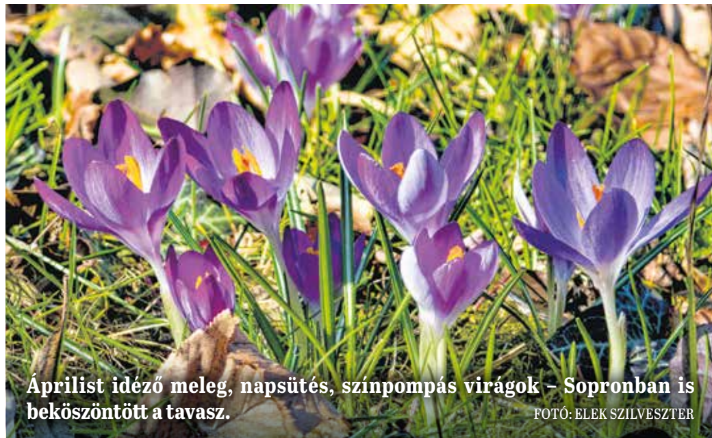
Áprilist idéző meleg, napsütés, színpompás virágok – Sopronban is beköszöntött a tavasz.