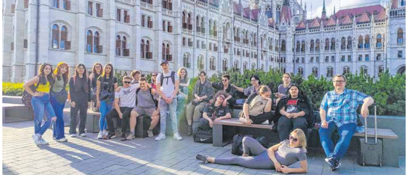
Az elmúlt tanévben osztálykirándulásokat és nyári vízi táborokat szerveztek a Handler-iskolában az adófelajánlásokból.