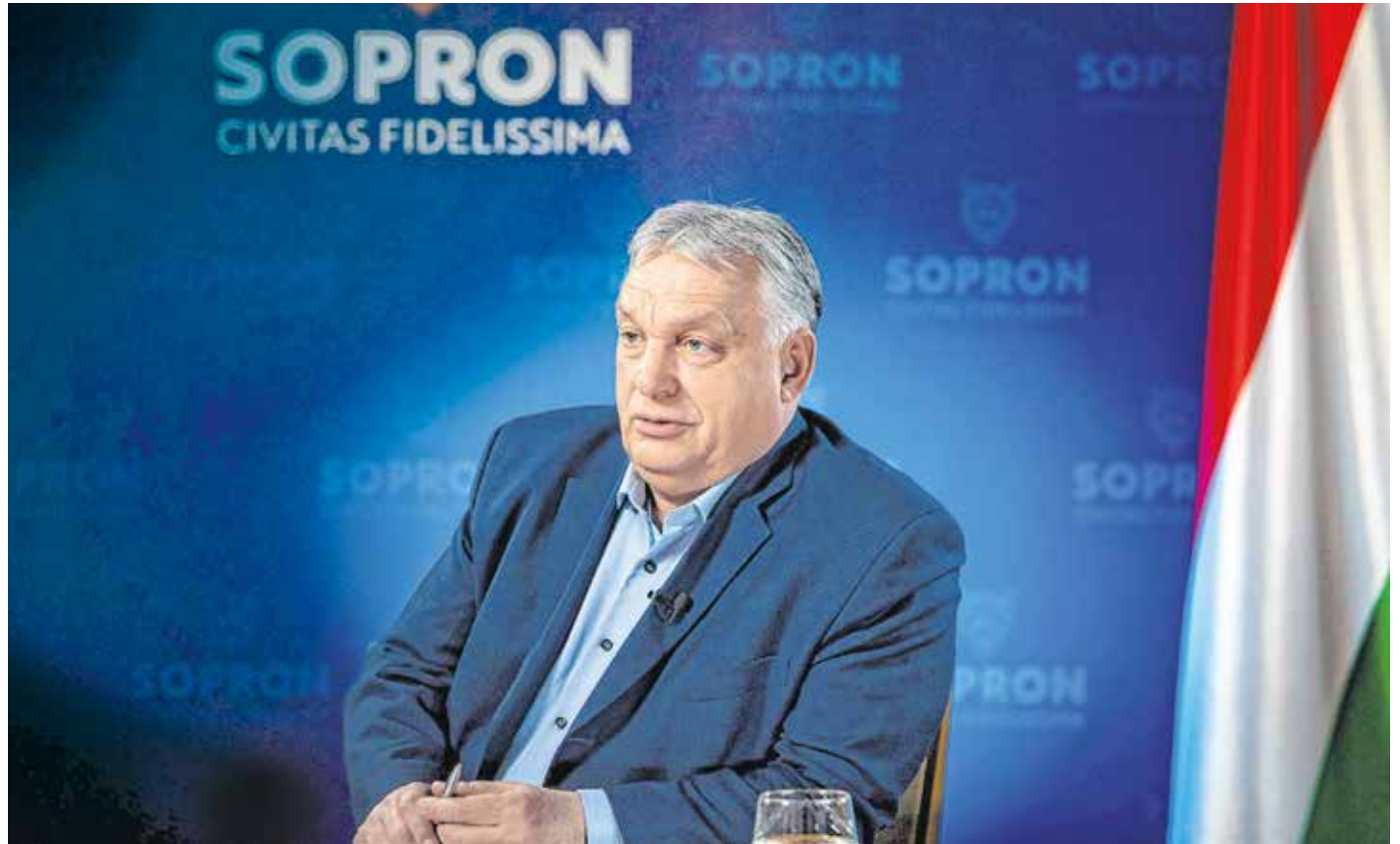
Sopron fantasztikus város, mert gyönyörű, és persze mindenki ismeri – nyilatkozta Orbán Viktor miniszterelnök.

(Az írás a Mediaworks és a Sopron Média által készített interjú szerkesztett változata.)