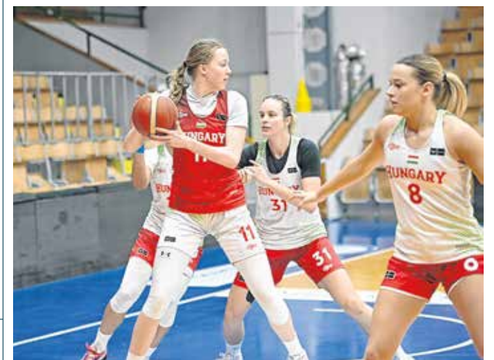
A magyar női kosárlabda-válogatott március 11. és 17. között lép pályára Izstambulban.

Izstambulban lép pályára női kosárlabda-válogatottunk a világbajnoki selejtezőtornán. A keretszűkítés után kiderült: három újonc is lehetőséghez jut. A válogatott március 11. és 17. között sorrendben Japán, Kanada, Ausztrália, Argentína és végül a házigazda Törökország legjobbjai ellen játszik. A csoportból Ausztrália mellett a három legeredményesebb együttes jut még ki a szeptemberi, Berlinben