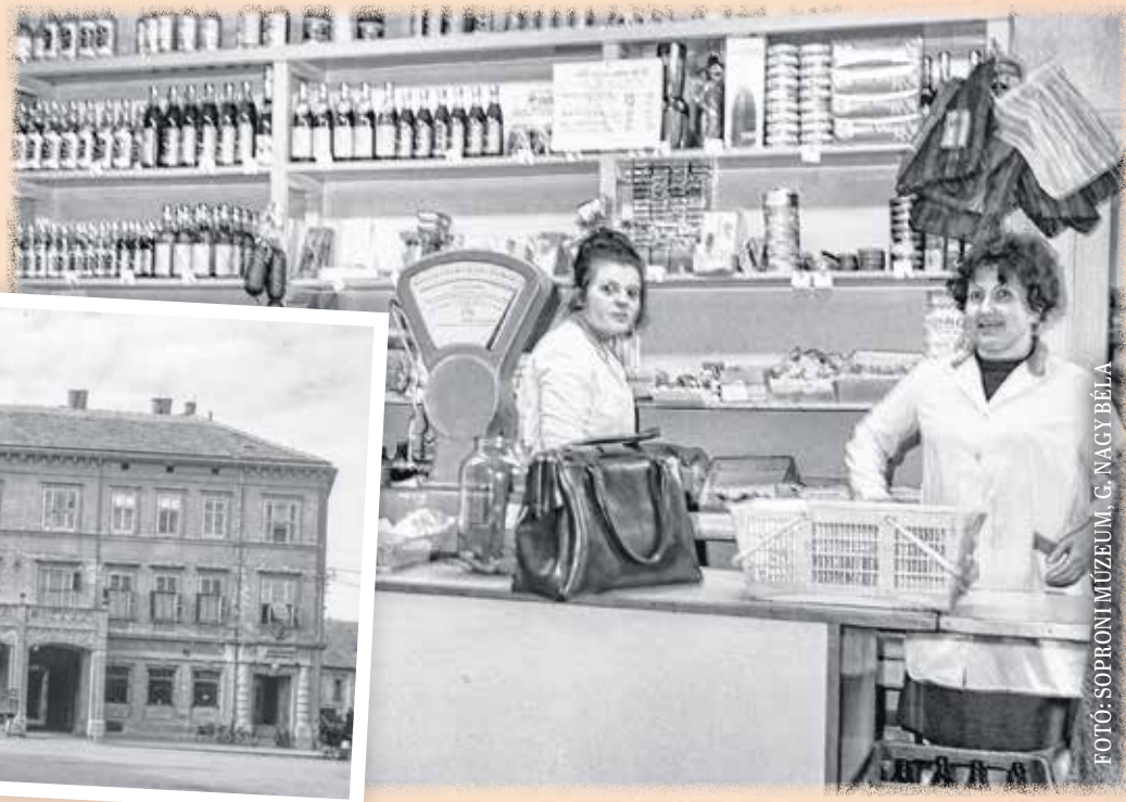
„Népboltbelső” az Ötvös utcában 1974 márciusában.

cukor, rizs, olaj, konzervek. Elöl üveges pult volt, amely egy helyen megszakadt, ahol a „nyílás” adott lehetőséget a kiszolgálásra. De a hangulatra emlékeztem az is, ahogy a „vitrin” fölött átnyújtotta a boltos a kért árut. A csomagoláshoz az asztalon nagyméretű papír, mellette papírzacsok feküdt, a sarokban a szódásüvegek visszaváltásához sorakoztak a rekeszek.