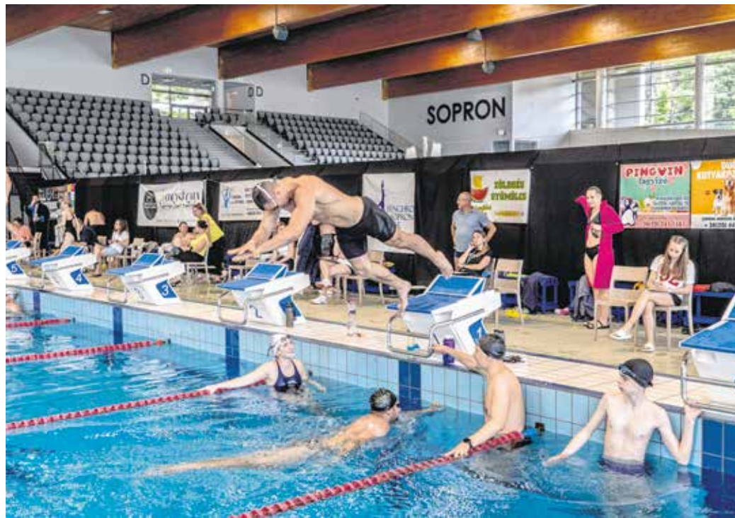
Újabb kiemelt úszóesemény Sopronban: április 15–19. között a Lóver uszoda ad otthont a felnőtt nagymedencés országos bajnokságnak.