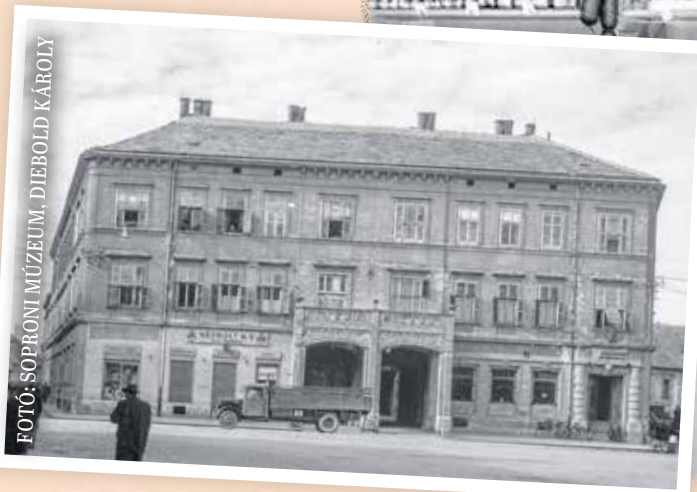
Népbolt 1950 körül a Széchenyi téren.

néven emlegették a vegyeskereskedéseket. Többféle, például mezőgazdasági üzletet, kisáruházakat is nyitottak, azonban volt egy jellemzően kisméretű, főleg falun vagy a belvárostól félreeső kerületekben megtalálható fajtája, amit továbbra is a régi néven emlegettek: „A népbolt”. Sokak számára a szó maig nosztalgikus: a régi falusi életet, a sorban állást, a jellegzetes illatokat és a kiszolgálás lassú ritmusát idézi. Belépve alacsony mennyezet, fehérre meszelt falak, a padlón linóleum, néhol kisméretű neonszővegek fogadtak. A levegőben keveredett a pékáru, a füstölt áru – ha éppen volt –, a mosópor és a savanyúság illata, ez volt a népbolt saját „parfümje”. A pult mögött állt a pénztárosnői, akit név szerint ismertünk. Jellegzetes arcát adta a képnek, ahogy a háttérben sorakoztak a fapalcok, rajtuk alapélelmiszerekkel: liszt,