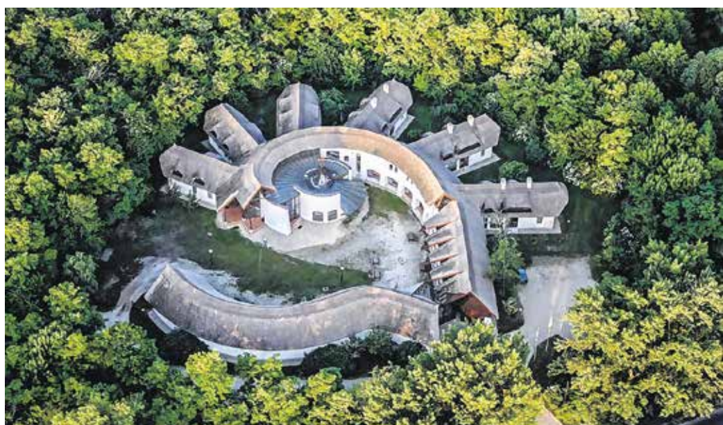
Megújítják, akadálymentesítik a Kócsagvár épületét.