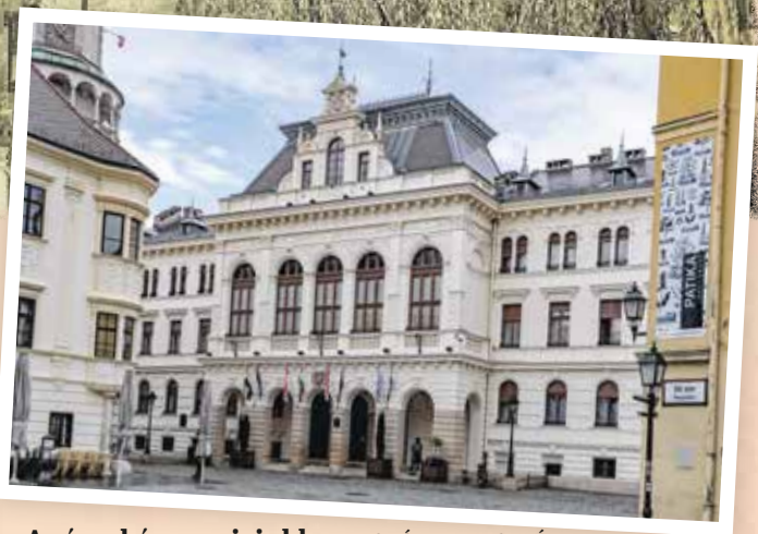
A városháza napjainkban.

belvárosnak. Akkoriban az elképzelés azzal a haszonnal is kecsegtetett, hogy az új levéltár falai olyan támaszt adnak a Tűztoronynak, hogy a beszűkített toronyátjáró újra kinyitható lesz. (Azért szűkítették le, mert a bontási munkálatok miatt repedések jelentek meg a toronyon, és a város jelképének ledőlésétől tartottak.) Tudjuk, hogy az átjáró megnyitására több mint száz évet kellett várni, amire nem