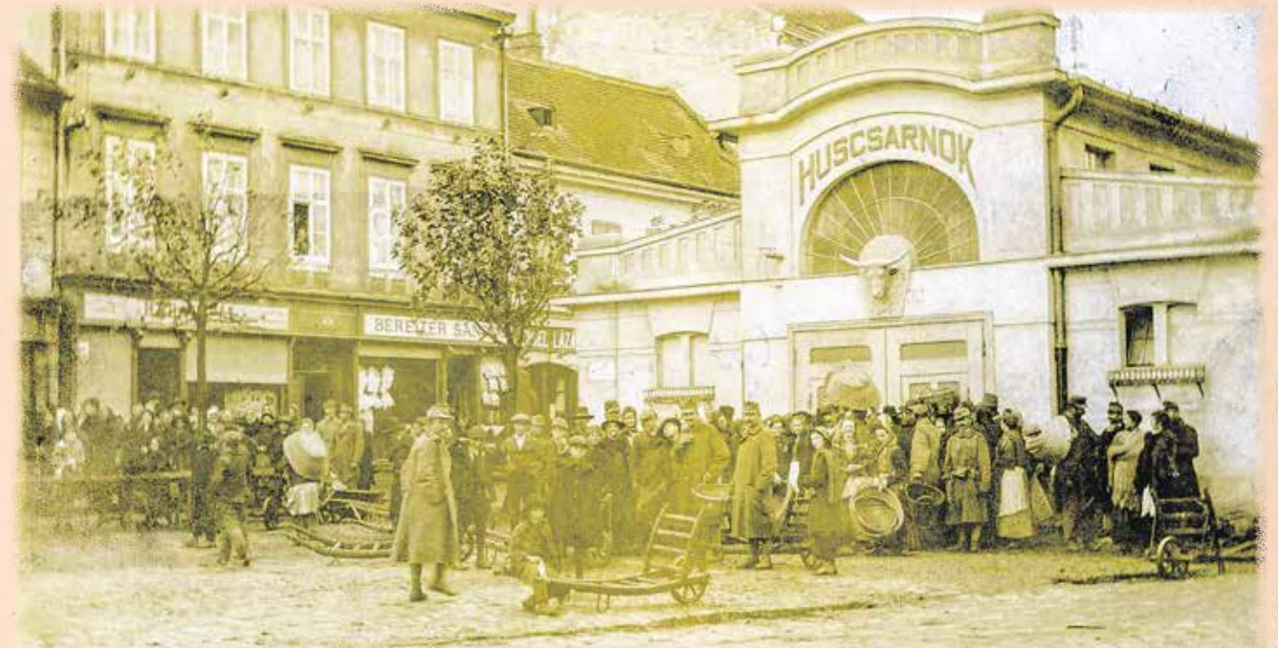
A régi húscsarnok a Kisvárkerületen 1915 körül – a sorbanállás mindennapos volt.

„... a kép nem csupán egy fontos ingatlant mutat: inkább egy kor lenyomata, a nélkülözés csendes, mégis megrendítő bizonyítéka...”