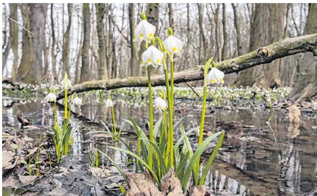
Az első tőzikek már kibújtak a földből Csáfordjánosfán.

Az első virágok már megjelentek a csáfordi tőzikek erdőben, a tömeges virágzás várhatóan február végén, március elején kezdődik – tette közzé Facebook-oldalán a Fertő-Hanság Nemzeti Park.