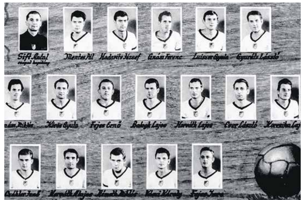
A Soproni Textiles legendás játékosai a 60-as években.