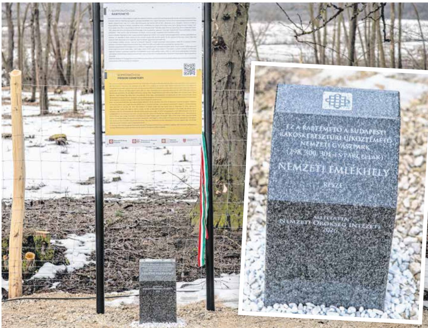
Nemzeti emlékhelyet jelölő parcellakövet avattak fel a sopronkőhidai rabtemetőben. A kő felett elhelyezett táblán ismertetik az emlékhely történetét.