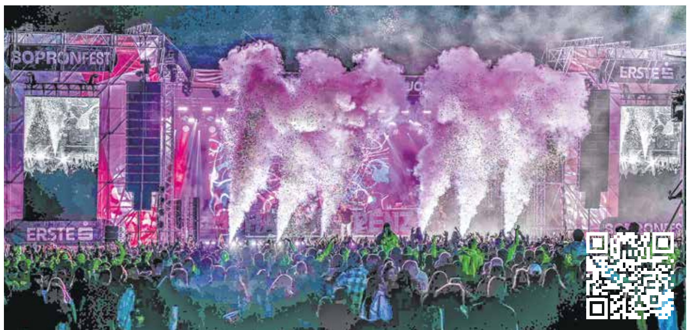
A hazai zenei élet meghatározó szereplői idén is fellépnek Sopronban.