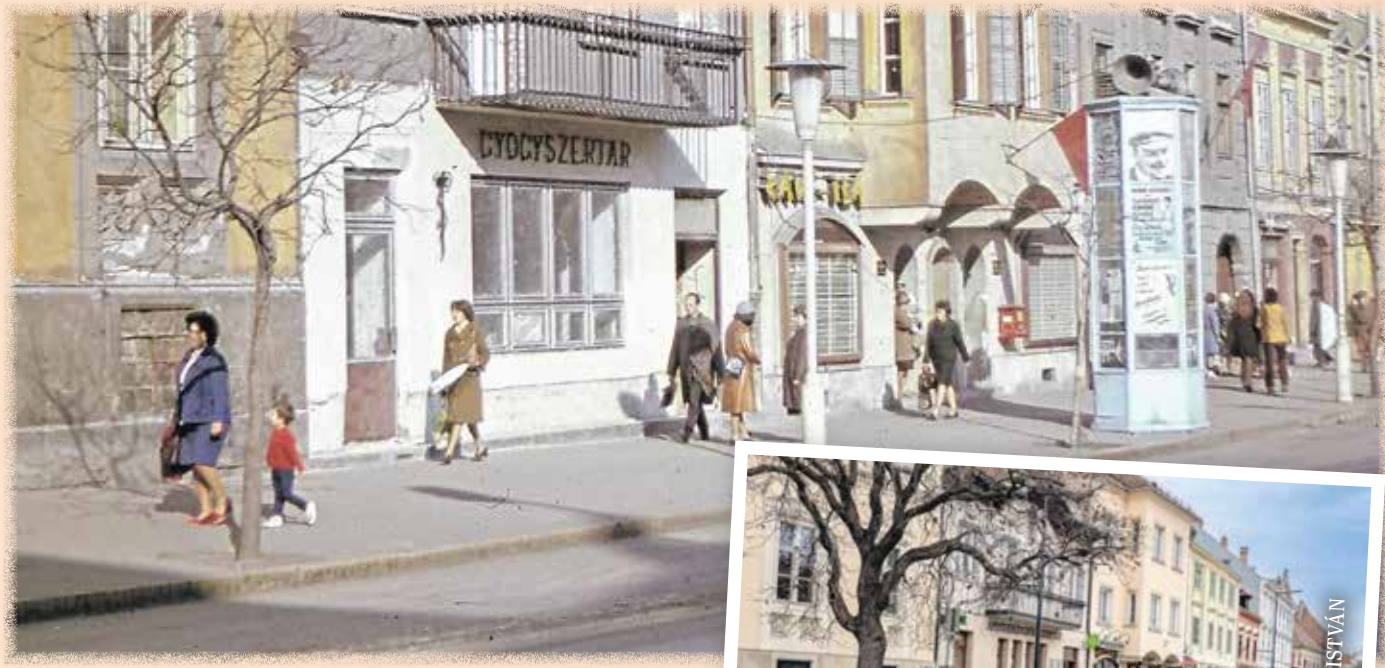
Várkerületi életkép hirdetőoszloppal és a tetején hangosbemondókkal 1970 körül.

„A hangosbemondón keresztül biztosították, hogy az állami propaganda minél több embert elérjen, hiszen az 50-es években még sokaknak nem telt rádiókészülékre.”