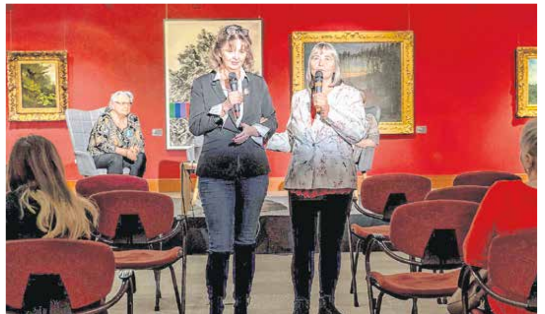
A kultúra közösségi élmény, a Pro Kultúra munkatársai igyekeznek felkészülten fogadni a látássérülteket is a rendezvényeiken.