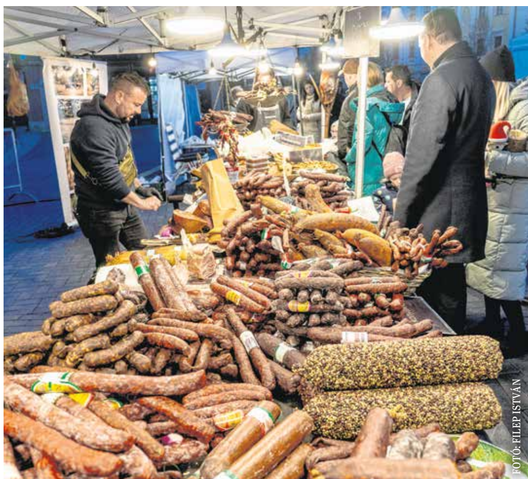
A rendezvényen magyar alapanyagokból készült ételeket kóstolhattak a résztvevők.

Az eseményen többek között helyi zenekarok, a Soproni Petőfi Színház művészei, valamint a Dumasínház tagjai gondoskodnak a felhőtlen szórakozásról.