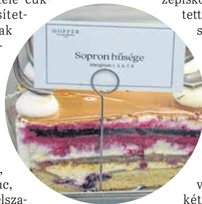
90 éve nyitotta meg cukrászdáját a Várkerület 86. számú házban a Hoffer család.

– A szívből jövő vendégszeretetet a legfontosabb, illetve a nagyszülők nyomdokaiban haladunk az alapanyagok szempontjából is. A háború árnyékában is igyekezték beszerezni a falusi tojást, a jó minőségű vaját, számunkra is nagyon fontos, hogy csak nagyon jó minőségű alapanyagokkal dolgozzunk. Bár természetesen az ízek terén – követve a kor elvárásait – sokat újítottunk, de aki ma belekóstol a házi krémesünkbe, megtapasztalhatja azt az ízelményt, amit kilencven évvel ezelőtt átélhettek a vendégek az egykori Hoffer cukrászdában.